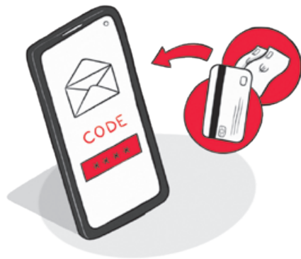
3. BEZAHLEN & ZUGANGSCODE ERHALTEN