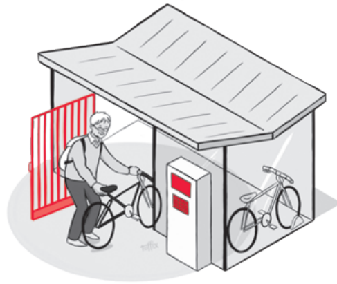
4. SICHER PARKEN