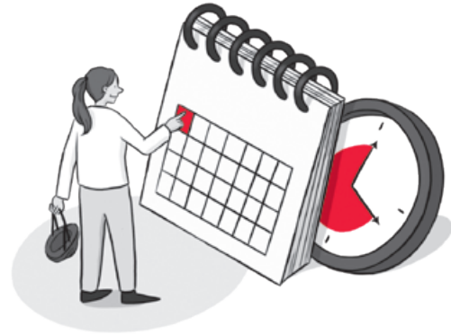
2. ABSTELLPLATZ BUCHEN