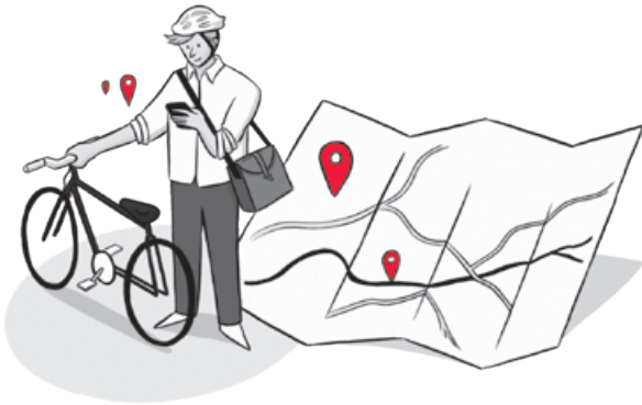
1. ABSTELLPLATZ AUSSUCHEN