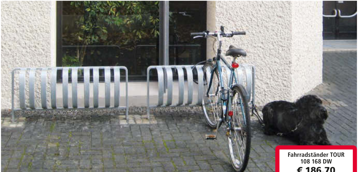
Fahrradständer TOUR einseitig, zum Einbetonieren, 3 Stellplätze, feuerverzinkt