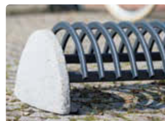
▲ Detail: Betonsockel