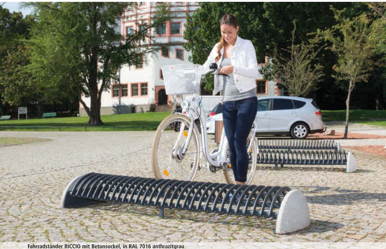
Fahrradständer RICCIO mit Betonsockel, in RAL 7016 anthrazitgrau