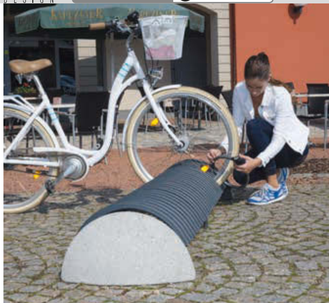
Fahrradständer RICCIO mit Betonsockel, in RAL 7016 anthrazitgrau