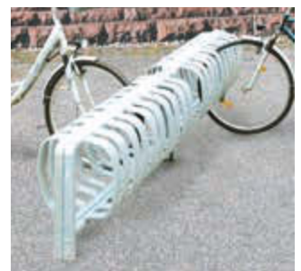
▲ Fahrradständer TOUR doppelseitig, zum Einbetonieren, 6 Stellplätze, feuerverzinkt