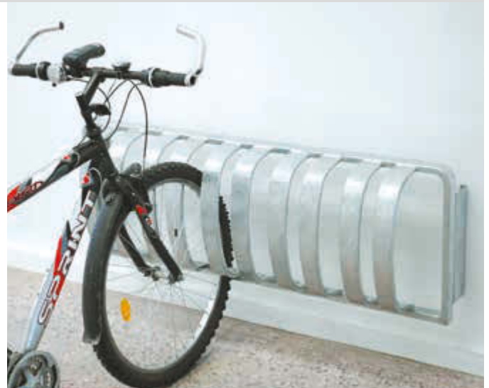
Fahrradständer TOUR zur Wandbefestigung, 3 Stellplätze, feuerverzinkt