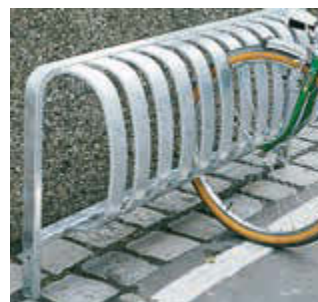
▲ Fahrradständer TOUR einseitig, zum Einbetonieren, 3 Stellplätze, feuerverzinkt