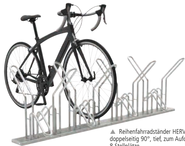
▲ Reihenradständer HERVEY doppelseitig 90°, tief, zum Aufdübeln, 8 Stellplätze