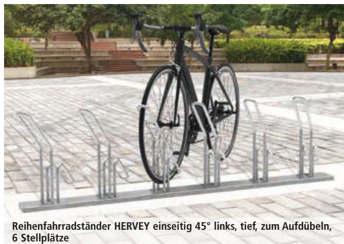
Reihenradständer HERVEY einseitig 45° links, tief, zum Aufdübeln, 6 Stellplätze