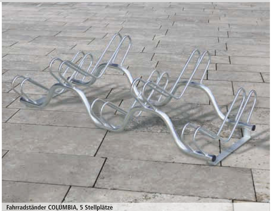
Fahrradständer COLUMBIA, 5 Stellplätze