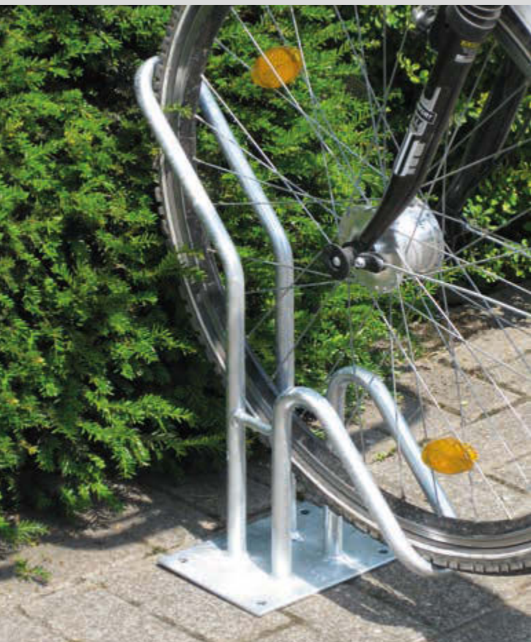
Einzelradständer HERVEY einseitig, tief, zum Aufdübeln, 1 Stellplatz

Konstruktion: Stabile Stahlkonstruktion. Radhalterung aus einem Stück gebogen, Rundrohr (Ø 20 mm). Einstellwinkel 45° und 90°. Einzelradständer in Einstellung tief bzw. hoch, Reihenradständer in tief bzw. hoch / tief. Radeinstellung 45° und 90°.