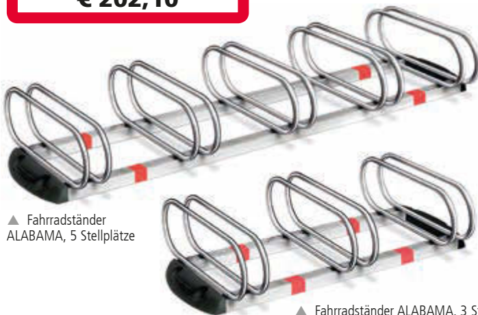
▲ Fahrradständer ALABAMA, 5 Stellplätze

Fahrradständer ALABAMA 483 040 DW € 202,10