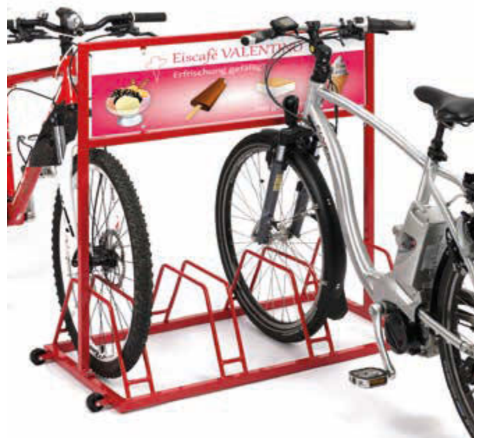
▲ Werbefahrradständer AKRON in RAL 3000 feuerrot

Weitere Werbefahrradständer online unter: www.ziegler-metall.at