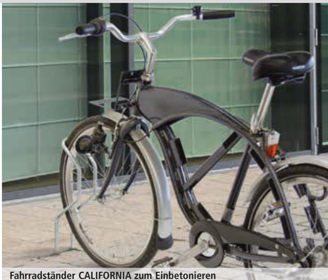
Fahrradständer CALIFORNIA zum Einbetonieren