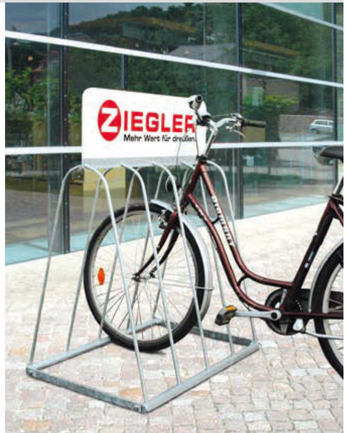
Werbefahrradständer WARWICK, 4 Stellplätze, feuerverzinkt