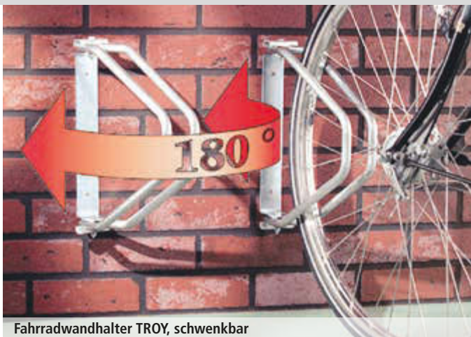
Fahrradwandhalter TROY, schwenkbar