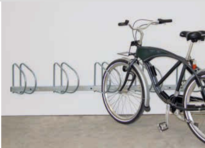
Fahrradwandhalter PRAG, 45° rechts