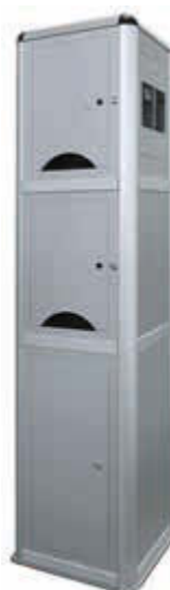
▲ Ladesäule CORVI, 2 kleine Schließfächer, integrierte Steuerzentale mit Zugangsautorisierung PIN-Code