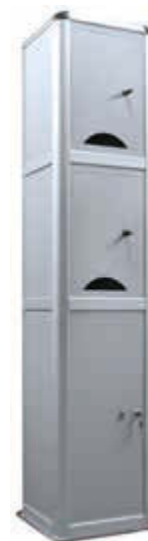
▲ Ladesäule CORVI, 2 kleine Schließfächer mit Münzpfandschließung