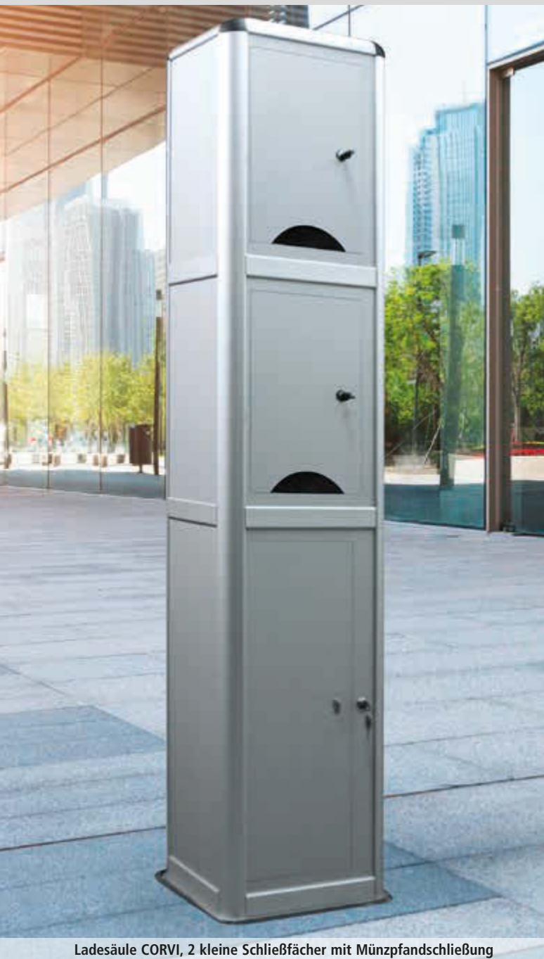
Ladesäule CORVI, 2 kleine Schließfächer mit Münzpfandschließung

Konstruktion: Witterungsbeständige Konstruktion, aus rostfreiem Aluminium. Anschlussfertig vorverdrahtet und nach der Installation und Inbetriebnahme durch eine Elektrofachkraft sofort betriebsbereit. Zuleitung erfolgt über Aussparung im Boden. Stromzuleitung bauseits mit Kabelquerschnitt min. 5 x 2,5 mm 2 bzw. max. 5 x 4,0 mm 2 .