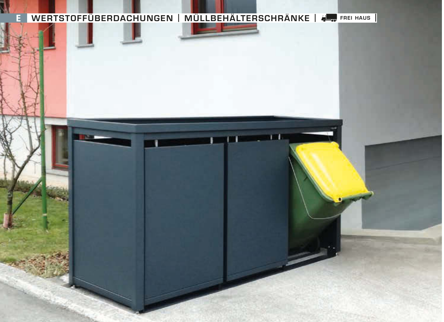
Müllbehälterschrank STYLEOUT® BLANK mit Pflanzdach, Dreifachschrank, Stahlkonstruktion, Dach, Schiebetüren, Rück- und Seitenwände in RAL 7016 anthrazitgrau