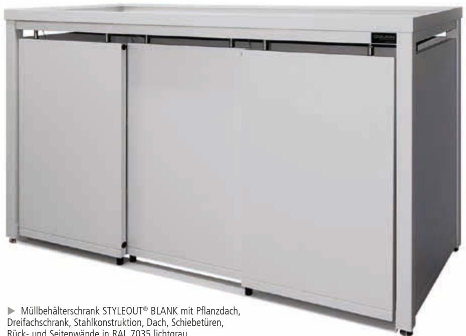
► Müllbehälterschrank STYLEOUT® BLANK mit Pflanzdach, Dreifachschrank, Stahlkonstruktion, Dach, Schiebetüren, Rück- und Seitenwände in RAL 7035 lichtgrau