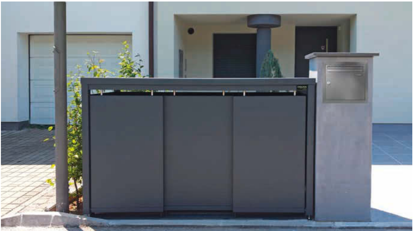
Müllbehälterschrank STYLEOUT® BLANK mit Pflanzdach, Dreifachschrank, Stahlkonstruktion, Dach, Schiebetüren, Rück- und Seitenwände in RAL 7016 anthrazitgrau

Weitere Bilder, Informationen und Ausschreibungstexte: www.ziegler-metall.at