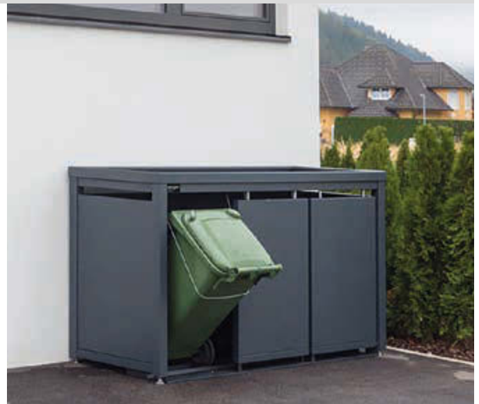
Müllbehälterschrank STYLEOUT® BLANK mit Pflanzdach, Dreifachschrank, Stahlkonstruktion, Dach, Schiebetüren, Rück- und Seitenwände in RAL 7016 anthrazitgrau

• Internationaler Designschutz (EUIPO Registrierungsnummer 003076363-0001)