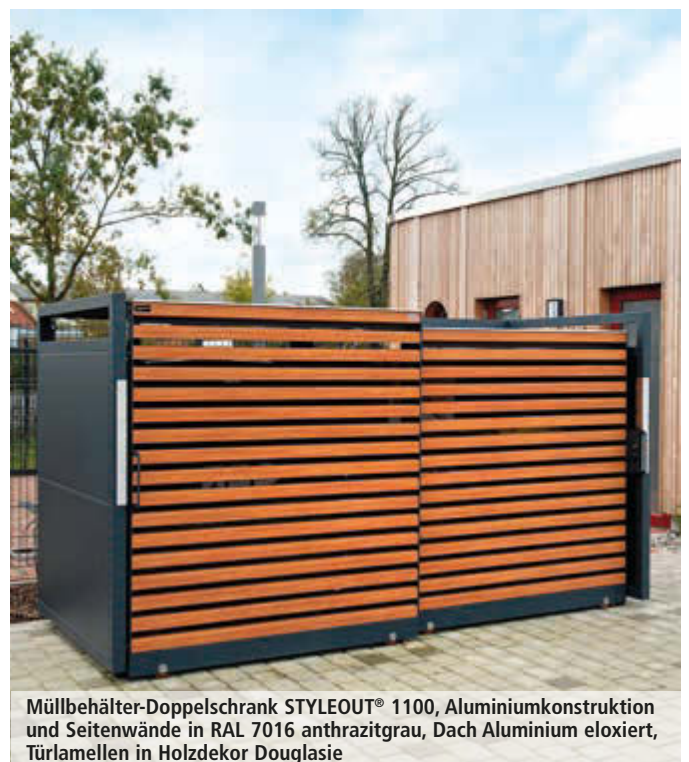
Müllbehälter-Doppelschrank STYLEOUT® 1100, Aluminiumkonstruktion und Seitenwände in RAL 7016 anthrazitgrau, Dach Aluminium eloxiert, Tür lamellen in Holzdekor Douglasie