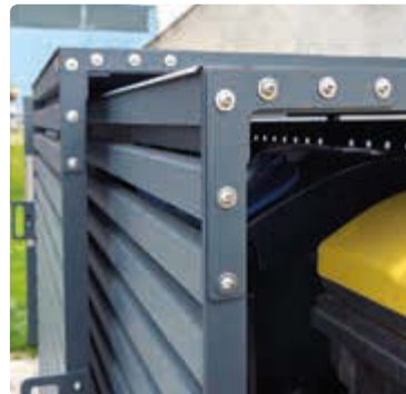
▲ Detail: Schiebetüren