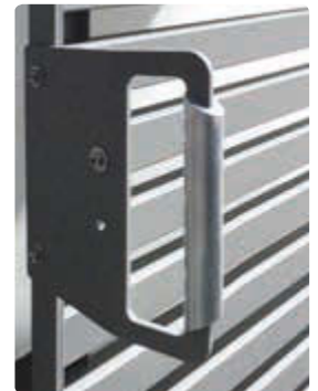
▲ Detail: Handgriff