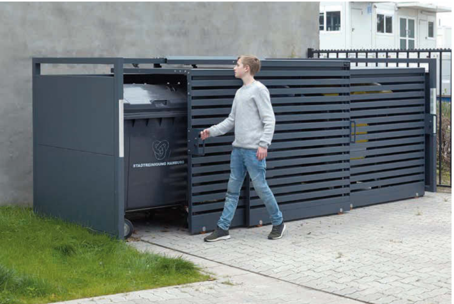
Müllbehälter-Dreifachschrank STYLEOUT® 1100, Stahlkonstruktion, Tür, Rück- und Seitenwände in RAL 7016 anthrazitgrau, Dach in Aluminium eloxiert