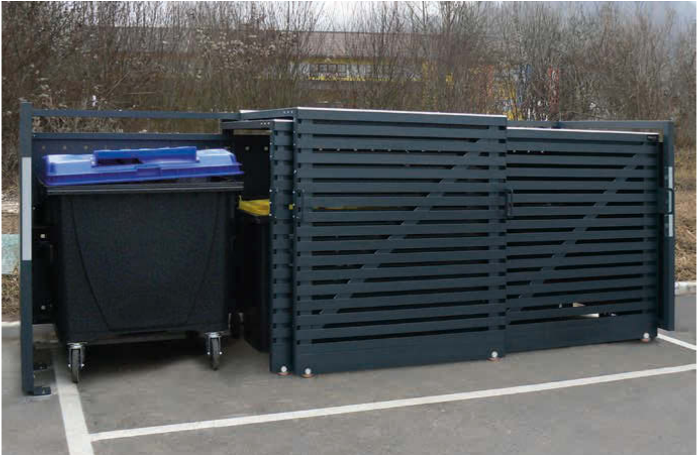
Müllbehälter-Dreifachschrank STYLEOUT® 1100, Stahlkonstruktion, Tür, Rück- und Seitenwände in RAL 7016 anthrazitgrau, Dach in Aluminium eloxiert