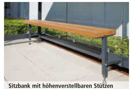
Sitzbank mit höhenverstellbaren Stützen