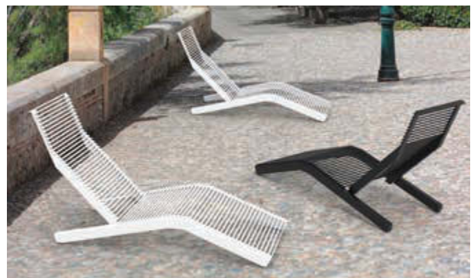
Liegebank RIVAGE zum freien Aufstellen, mit Rundstahlauflege in RAL 9010 reinweiß und RAL 7016 anthrazitgrau