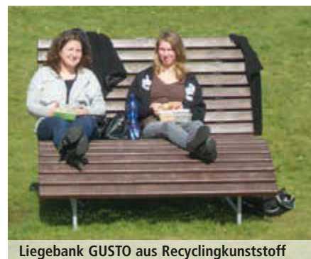
Liegebank GUSTO aus Recyclingkunststoff