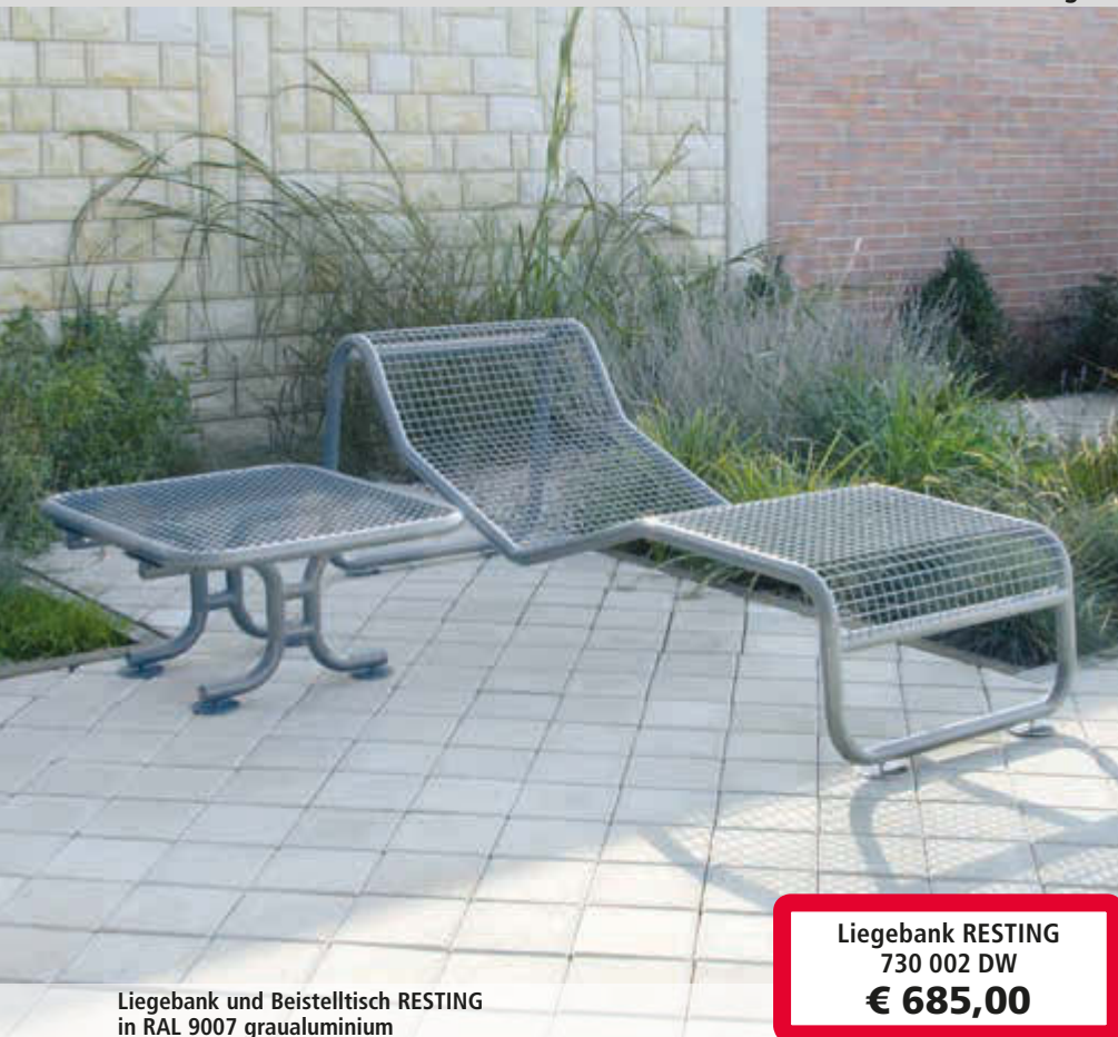
Liegebank und Beistelltisch RESTING in RAL 9007 graualuminium