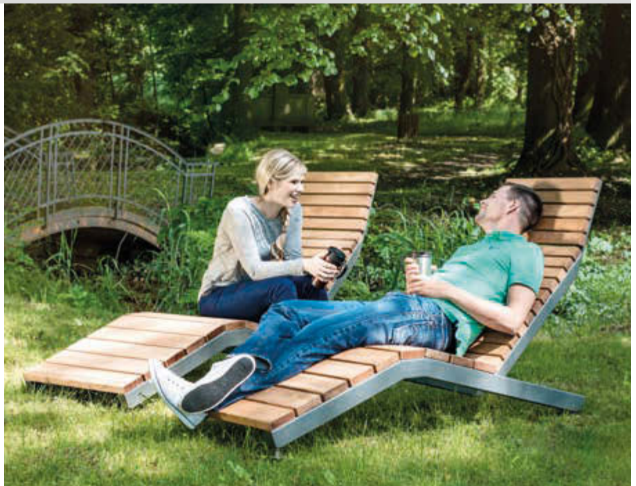
Liegebänke RIVAGE, zum freien Aufstellen, mit Jatobaholzbelattung, Stahlteile in DB 703 eisenglimmer