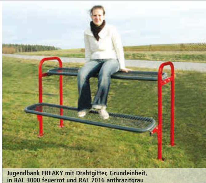
Jugendbank FREAKY mit Drahtgitter, Grundeinheit, in RAL 3000 feuerrot und RAL 7016 anthrazitgrau