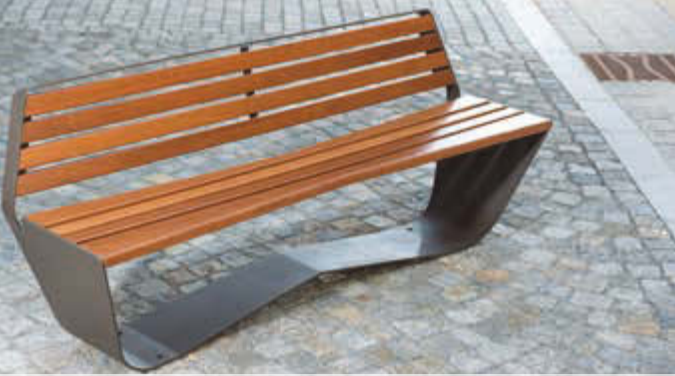
Sitzbank KARMA mit Rückenlehne, Stahlteile in DB 703 eisenglimmer

Die komplette Kollektion KARMA finden Sie online unter: www.ziegler-metall.at