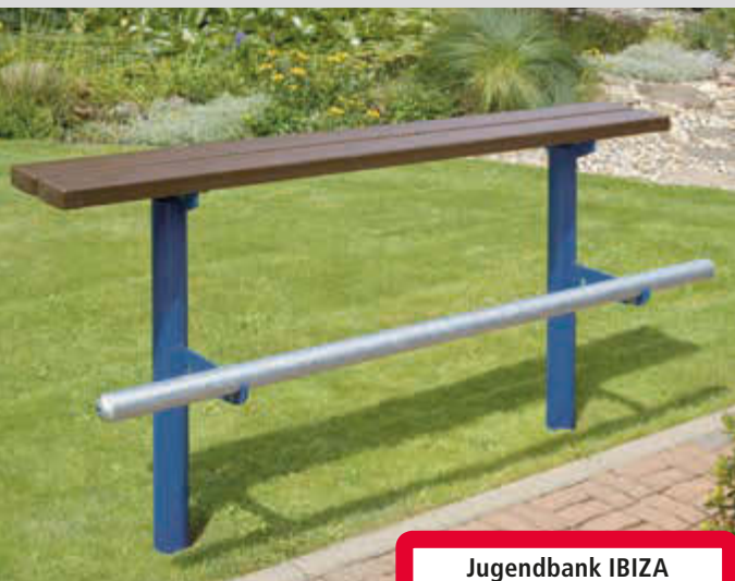
Jugendbank IBIZA, Stahlgestell in RAL 5010 enzianblau