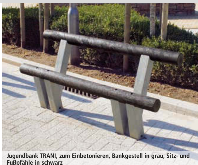
Jugendbank TRANI, zum Einbetonieren, Bankgestell in grau, Sitz- und Fußpfähle in schwarz