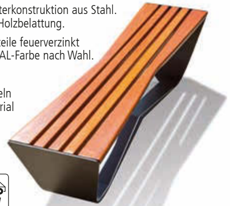
▲ Sitzbank KARMA ohne Rückenlehne, Stahlteile in DB 703 eisenglimmer