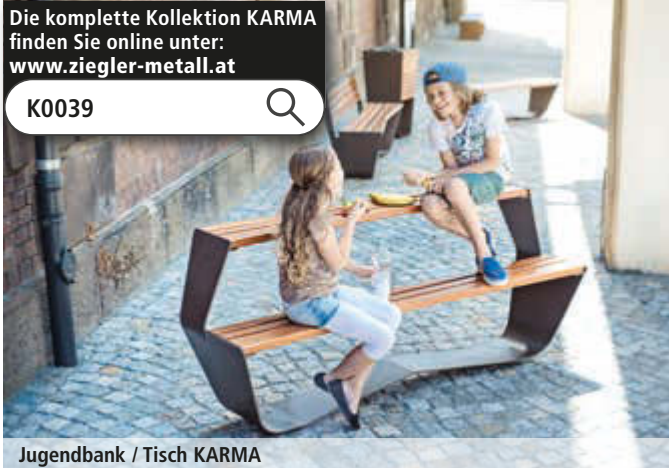
Jugendbank / Tisch KARMA