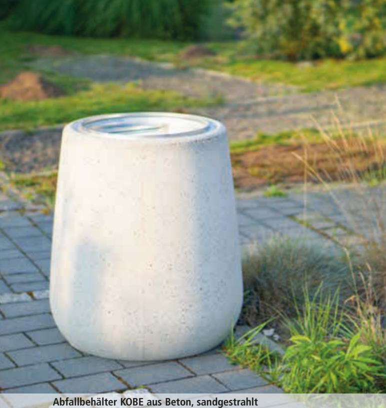
Abfallbehälter KOBE aus Beton, sandgestrahlt

Konstruktion: Abfallbehälter aus Beton mit verzinktem Innenbehälter aus Stahl mit integriertem Ascher.