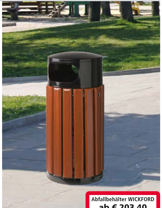
Abfallbehälter WICKFORD, 40 Liter