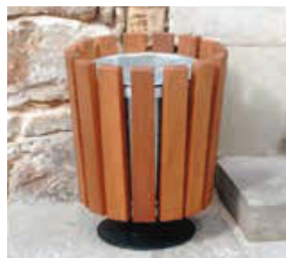
Abfallbehälter DORSET, zum freien Aufstellen