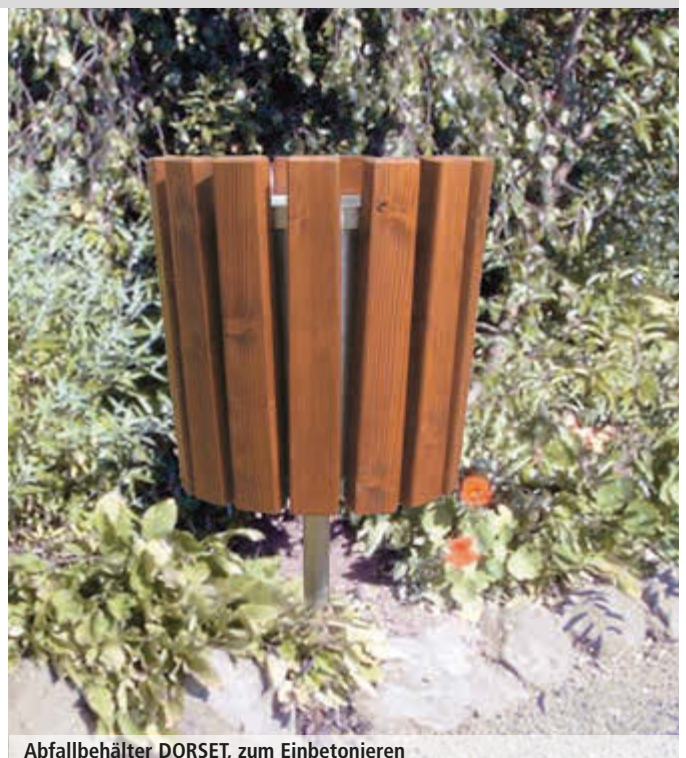
Abfallbehälter DORSET, zum Einbetonieren