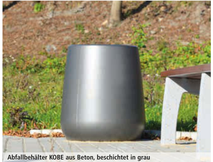
Abfallbehälter KOBE aus Beton, beschichtet in grau