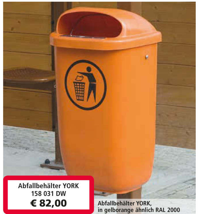
Abfallbehälter YORK 158 031 DW € 82,00