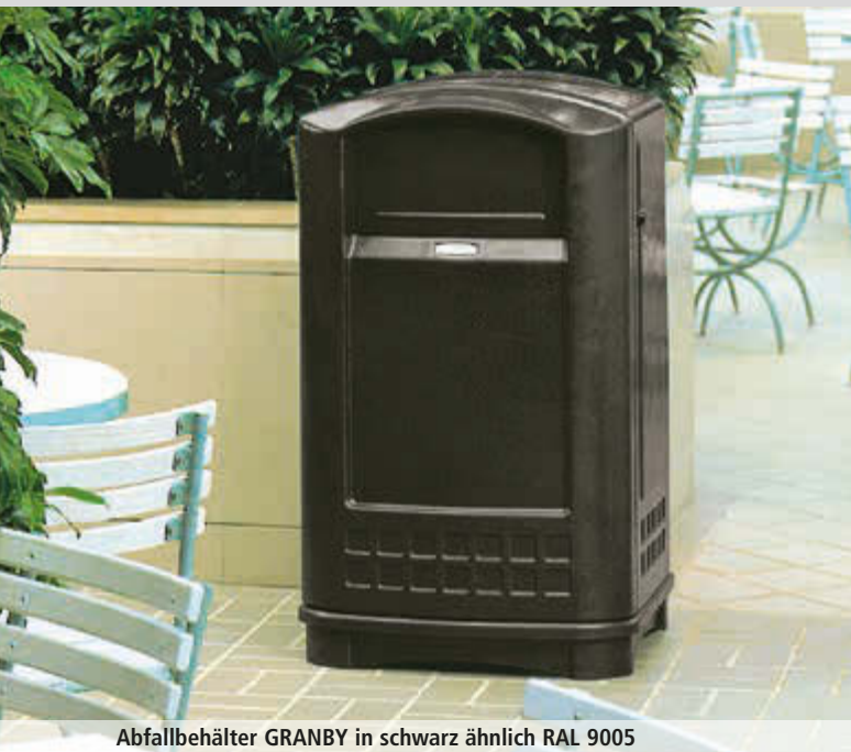
Abfallbehälter GRANBY in schwarz ähnlich RAL 9005