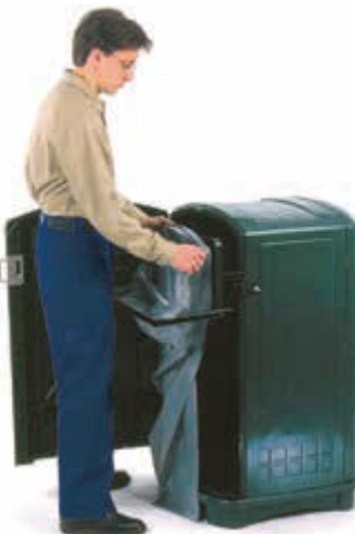
▲ standardmäßig mit ausfahrbarem Abfallsackhalter