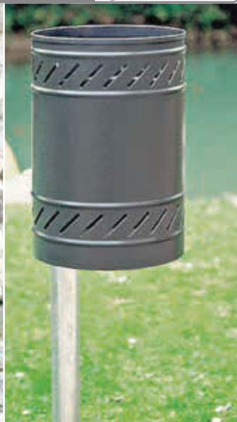
Abfallbehälter MAGGIOLINO ohne Schutzdach, Behälter in RAL 7012 basaltgrau, feuerverzinkter Pfosten zum Einbetonieren

Konstruktion: Aus formgepresstem Stahlblech. Wahlweise mit Schutzdach. Behälterboden mit Flüssigkeitsablauföchern.