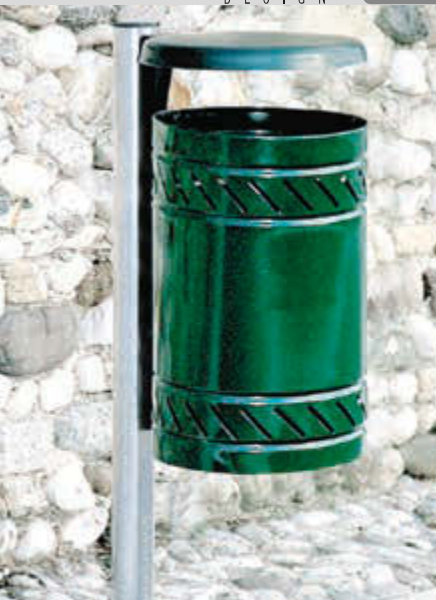
Abfallbehälter MAGGIOLINO mit Schutzdach, Behälter und Schutzdach in RAL 6005 moosgrün, feuerverzinkter Pfosten zum Einbetonieren