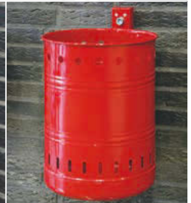
▲ Abfallbehälter NOSTALGIA mit Lochoptik, Inhalt 20 Liter, feuerverzinkt ▲ Abfallbehälter NOSTALGIA mit Lochoptik, Inhalt 35 Liter, in RAL 3002 karminrot