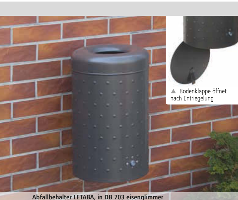
Abfallbehälter LETABA, in DB 703 eisenglimmer