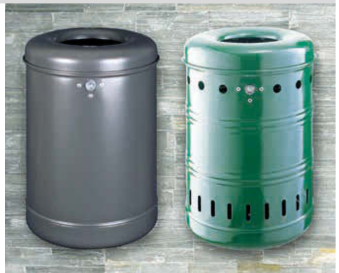
▲ Abfallbehälter BURNABY, Vollblech, in RAL 7016 anthrazitgrau ▲ Abfallbehälter BURNABY, mit Lochoptik, in RAL 6005 moosgrün