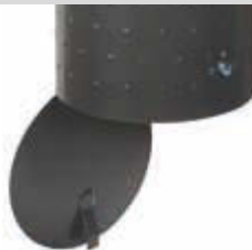
▲ Bodenklappe öffnet nach Entriegelung