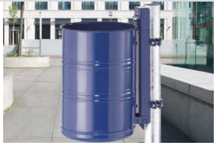
Abfallbehälter NOSTALGIA, Vollblech, 35 Liter, in RAL 5013 kobaltblau, mit Befestigungsschellen-Set (Mehrpreis) befestigt an feuerverzinktem Pfosten (Zubehör)