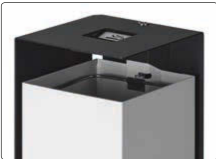
▲ Detail: Ascher