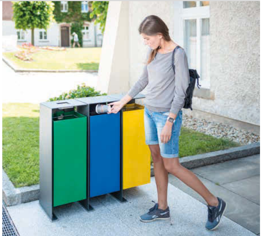
Abfallbehälter DIVISION (1 Behälter inkl. Ascher), 60 Liter, lückenlos nebeneinander platziert, Korpus Behälter in RAL 6029 minzgrün, in RAL 5010 enzianblau und in RAL 1021 rapsgelb