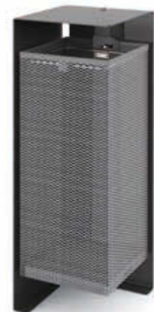
▲ Abfallbehälter DIVISION, 60 Liter, Korpus Behälter aus Streckmetall, in RAL 7016 anthrazitgrau

Abfallbehälter SURREY TRIO finden Sie online unter: www.ziegler-metall.at