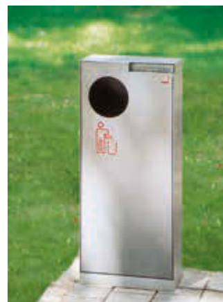
▲ Abfallbehälter CRYSTAL mit Ascher, 55 Liter, ohne Einwurfklappe, aus Edelstahl, Siebdruck in RAL 3020 verkehrsrot

Standascher CRYSTAL und Hundetoilette CRYSTAL finden Sie auf den Seiten 443 und 446.