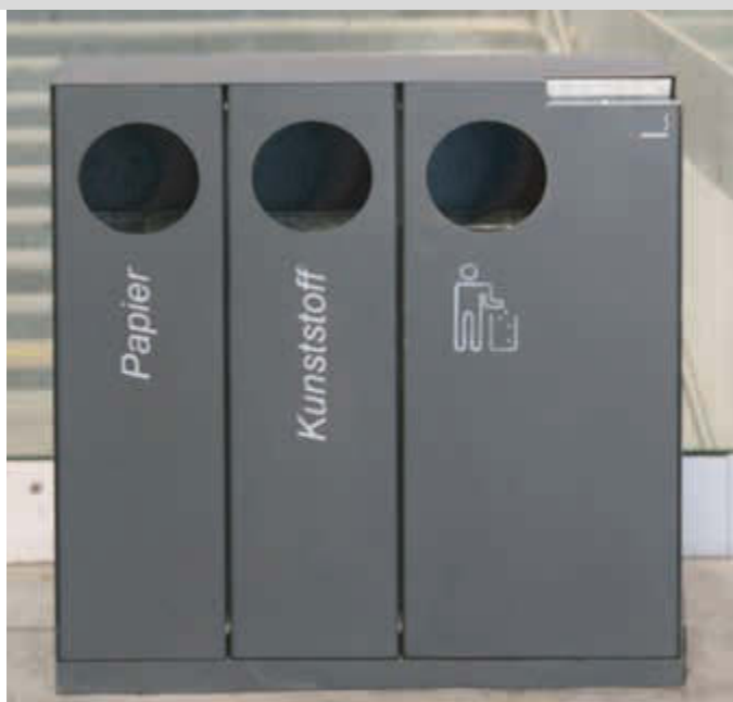
Abfallbehälter CRYSTAL TRIO mit 1 Ascher, 2 x 32 und 1 x 55 Liter, ohne Einwurfklappe, in DB 703 eisenglimmer, Siebdruck in RAL 9003 signalweiß

Konstruktion: Abfallbehälter aus Stahl mit Ascher aus Edelstahl bzw. komplett aus Edelstahl, Behälter wahlweise mit Einwurfklappe. Abfallbehälter CRYSTAL TRIO zur 3-fach-Mülltrennung. Entsorgungskennzeichen unter der Einwurföffnung (Papier, Kunststoff, „Saubermännchen“). Einzelbehälter standardmäßig mit Entsorgungskennzeichen „Saubermännchen“. Siebdruck in Standardfarben gemäß Tabelle. Lieferung inkl. feuerverzinktem Innenbehälter.