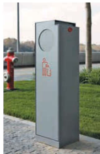
▲ Abfallbehälter CRYSTAL mit Ascher, 32 Liter, mit Einwurfklappe, in RAL 9007 grau-aluminium, Siebdruck in RAL 3020 verkehrsrot