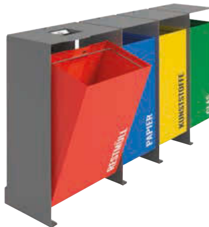
▲ Abfallbehälter DIVISION (1 x 100 Liter inkl. Ascher und 3 x 60 Liter), mit Beschriftung