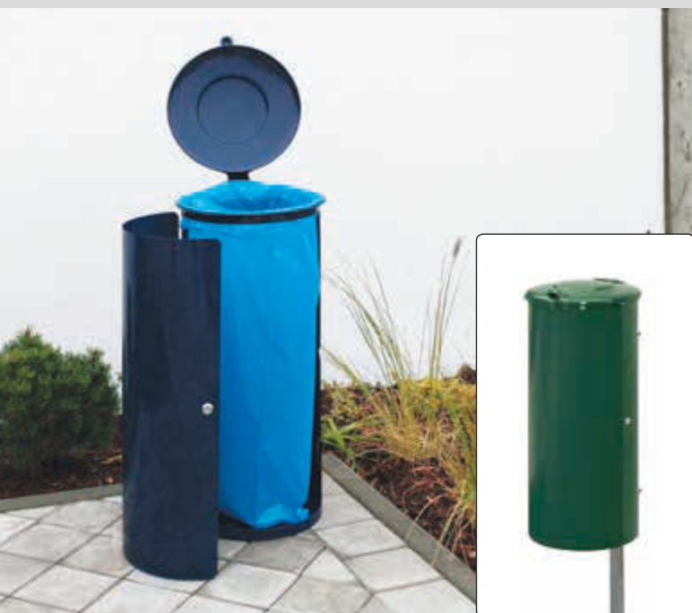
▲ Abfallbehälter NEWPORT, 110 Liter, zum Aufdübeln, in RAL 5013 kobaltblau