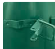
▲ Detail: Bügelverschluss