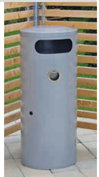
▲ Abfallbehälter AMOS mit Ascher, 70 Liter, in weißaluminium ähnlich RAL 9006