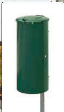
▲ Abfallbehälter NEWPORT, 110 Liter, zum Einbetonieren, in RAL 6005 moosgrün