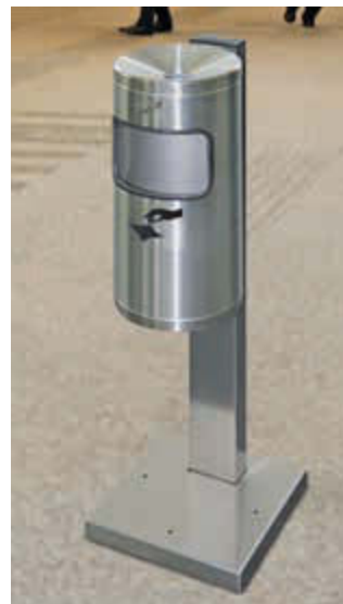
Abfallbehälter GLASGOW mit Ascher, aus Edelstahl, mit Standfuß zum Aufdübeln (Zubehör)