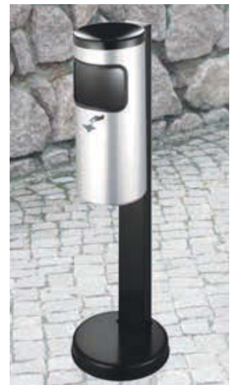
Abfallbehälter GLASGOW mit Ascher, in weißaluminium ähnlich RAL 9006, mit Standfuß zum freien Aufstellen (Zubehör)