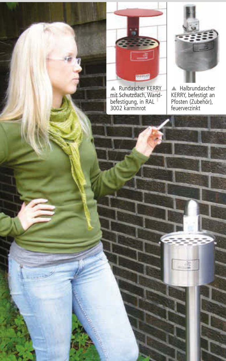
▲ Rundascher KERRY mit Schutzdach, Wandbefestigung, in RAL 3002 karminrot