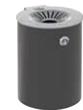
Wandascher M2 aus Edelstahl