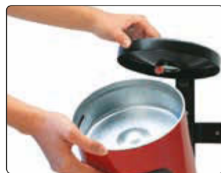
Entleerung vom Abfallbehälter GLASGOW mit Ascher, in RAL 3001 signalrot, zur Wandbefestigung