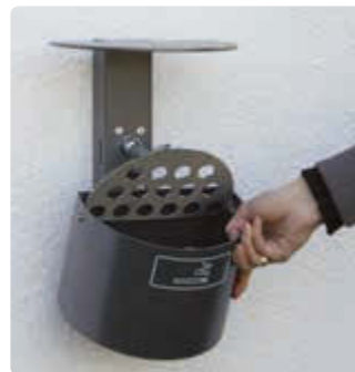
▲ Entleerung von Halbrundascher KERRY mit Schutzdach, Wandbefestigung, in DB 703 eisenglimmer