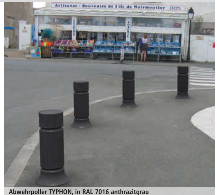
Abwehrpoller TYPHON, in RAL 7016 anthrazitgrau

Weitere Abwehrpoller finden Sie online unter: www.ziegler-metall.at