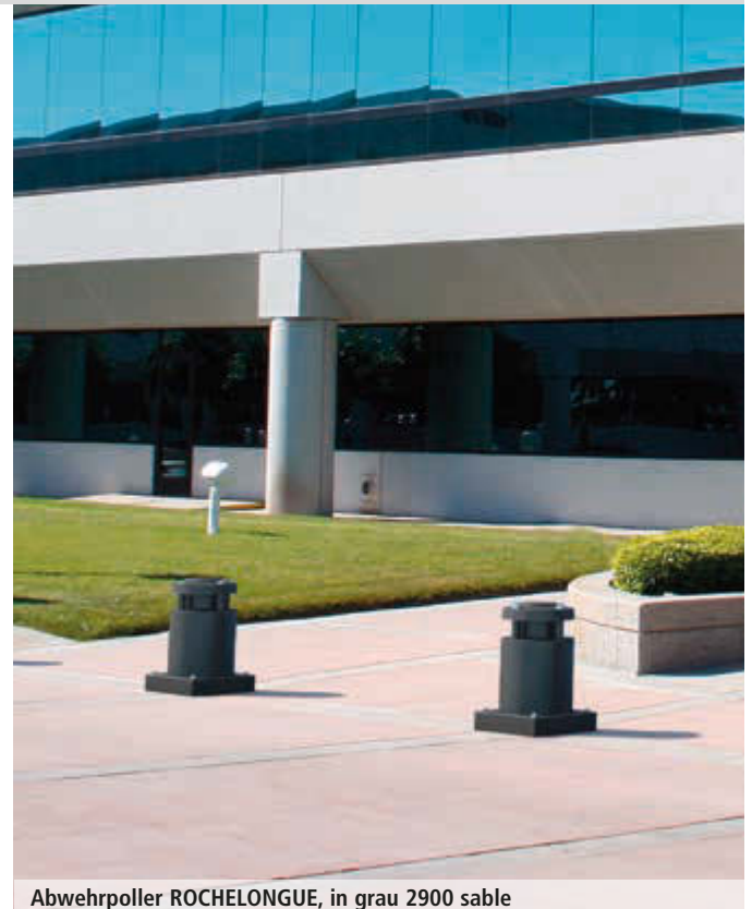
Abwehrpoller ROCHELONGUE, in grau 2900 sable