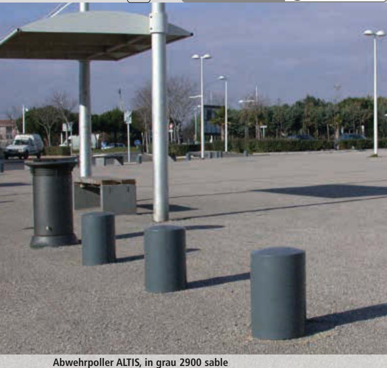
Abwehpoller ALTIS, in grau 2900 sable