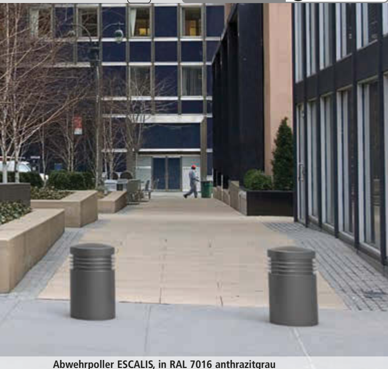
Abwehpoller ESCALIS, in RAL 7016 anthrazitgrau