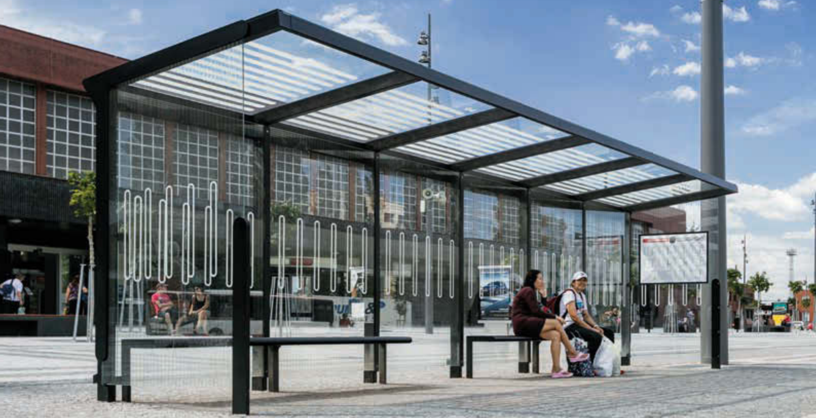
Wartehalle AUREO mit Pultdach, auftragsbezogene Anpassung, Dachbreite x Dachtiefe 8350 mm x 1855 mm, Seiten- und Rückwände ESG Klarglas mit Scheibendekor, inkl. Schaukasten und Sitzbänke, Stahlkonstruktion in RAL 7016 anthrazitgrau