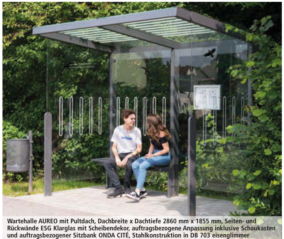
Wartehalle AUREO mit Pultdach, Dachbreite x Dachtiefe 2860 mm x 1855 mm, Seiten- und Rückwände ESG Klarglas mit Scheibendekor, auftragsbezogene Anpassung inklusive Schaukasten und auftragsbezogener Sitzbank ONDA CITÉ, Stahlkonstruktion in DB 703 eisenglimmer