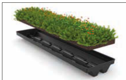
▲ Sedum-Kassettensystem aus recyceltem HDPE für Wartehalle AQUILA GREEN