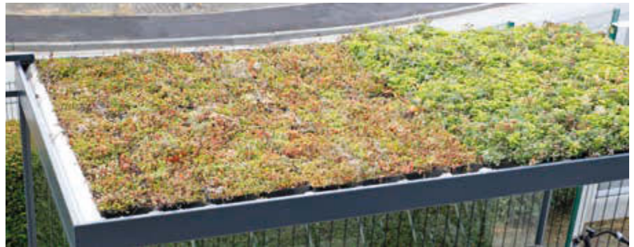
▲ links: Dachbegrünungssystem Economy, rechts: Dachbegrünungssystem Premium

Preis ohne Zubehör (Schaukasten, Sitzbank), inkl. Fracht, unabeladen.