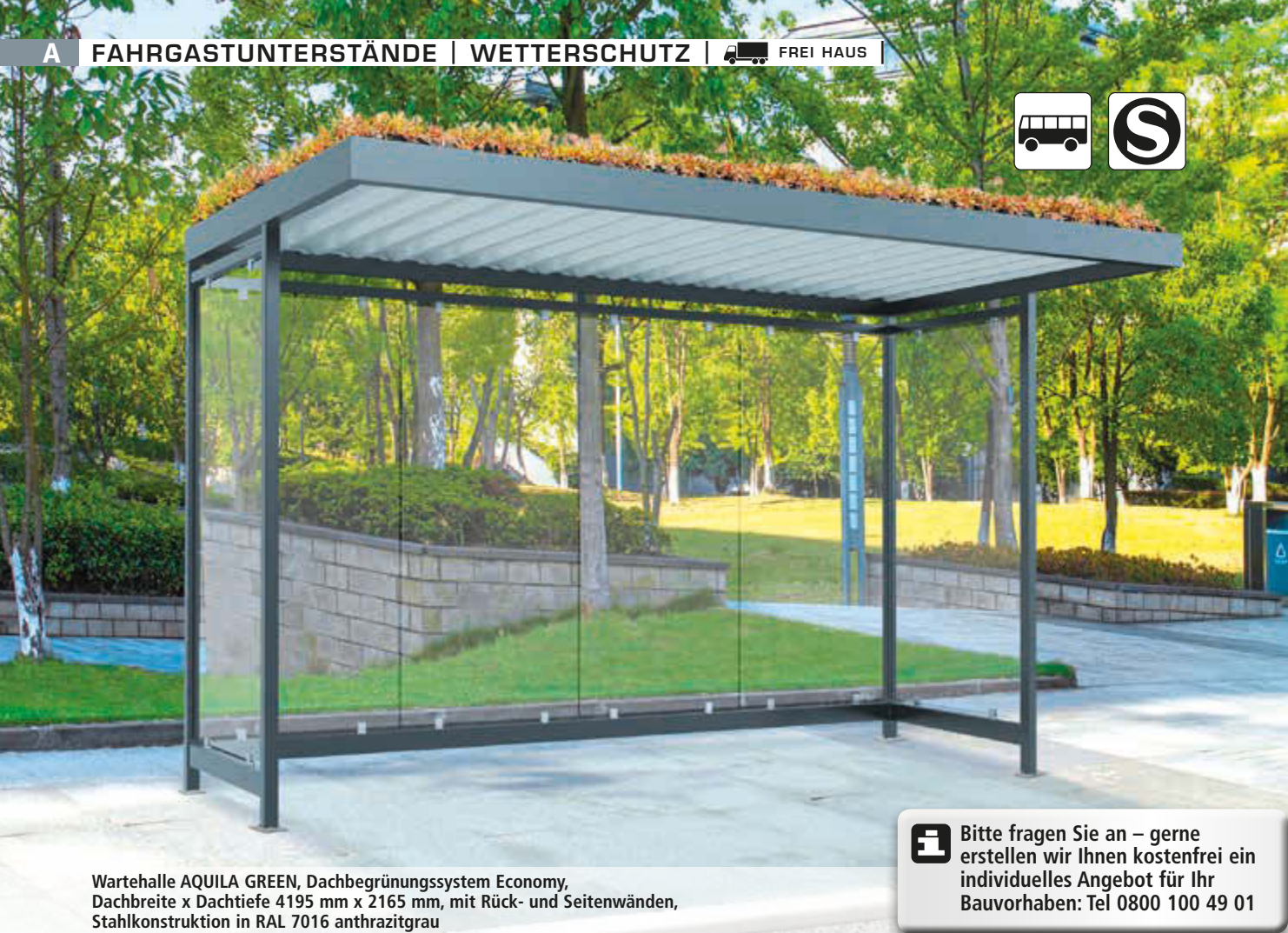
Wartehalle AQUILA GREEN, Dachbegrünungssystem Economy, Dachbreite x Dachtiefe 4195 mm x 2165 mm, mit Rück- und Seitenwänden, Stahlkonstruktion in RAL 7016 anthrazitgrau

Bitte fragen Sie an – gerne erstellen wir Ihnen kostenfrei ein individuelles Angebot für Ihr Bauvorhaben: Tel 0800 100 49 01