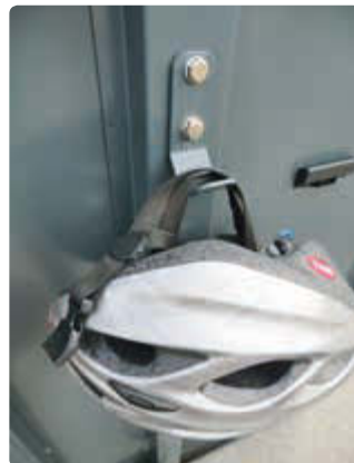
▲ Detail: Kleiderhaken an der Türinnenseite