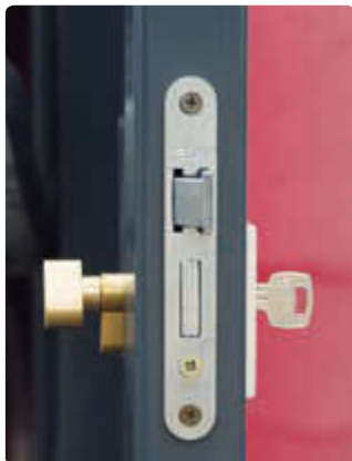
▲ Detail: Schließsystem mit stabilem Einsteckschloss und innenliegender Notentriegelung

Fahrradgarage SLIGO, Elektroleiste mit 230V-Steckdose und LED-Licht, Stahlkonstruktion in RAL 7016 anthrazitgrau, Wandelemente in RAL 3003 rubinrot, mit Innenwandbeschichtung (Mehrpreis)