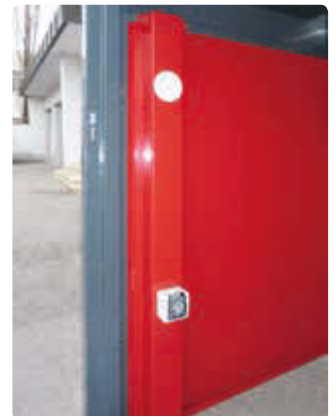
▲ Detail: Elektroleiste mit 230V-Steckdose und LED-Licht