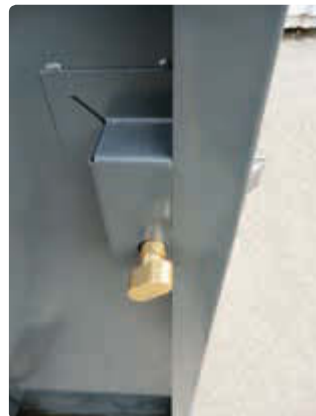
▲ Detail: innenliegende Notentriegelung