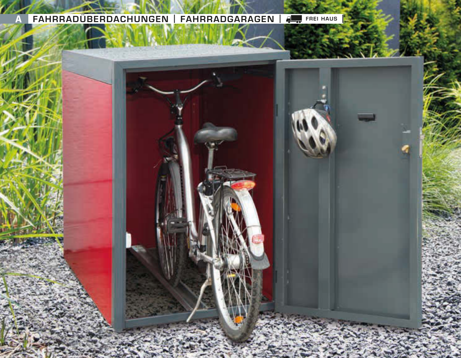
Fahrradgarage SLIGO, Elektroleiste mit 230V-Steckdose und LED-Licht, Stahlkonstruktion in RAL 7016 anthrazitgrau, Wandelemente in RAL 3003 rubinrot, mit Innenwandbeschichtung (Mehrpreis)