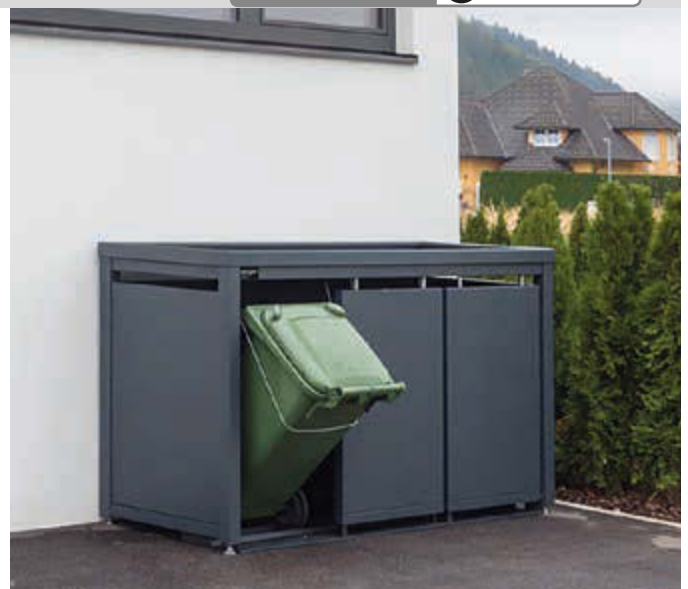
Müllbehälterschrank STYLEOUT® BLANK mit Pflanzdach, Dreifachschrank, Stahlkonstruktion, Dach, Schiebetüren, Rück- und Seitenwände in RAL 7016 anthrazitgrau

• Internationaler Designschutz (EUIPO Registrierungsnummer 003076363-0001)