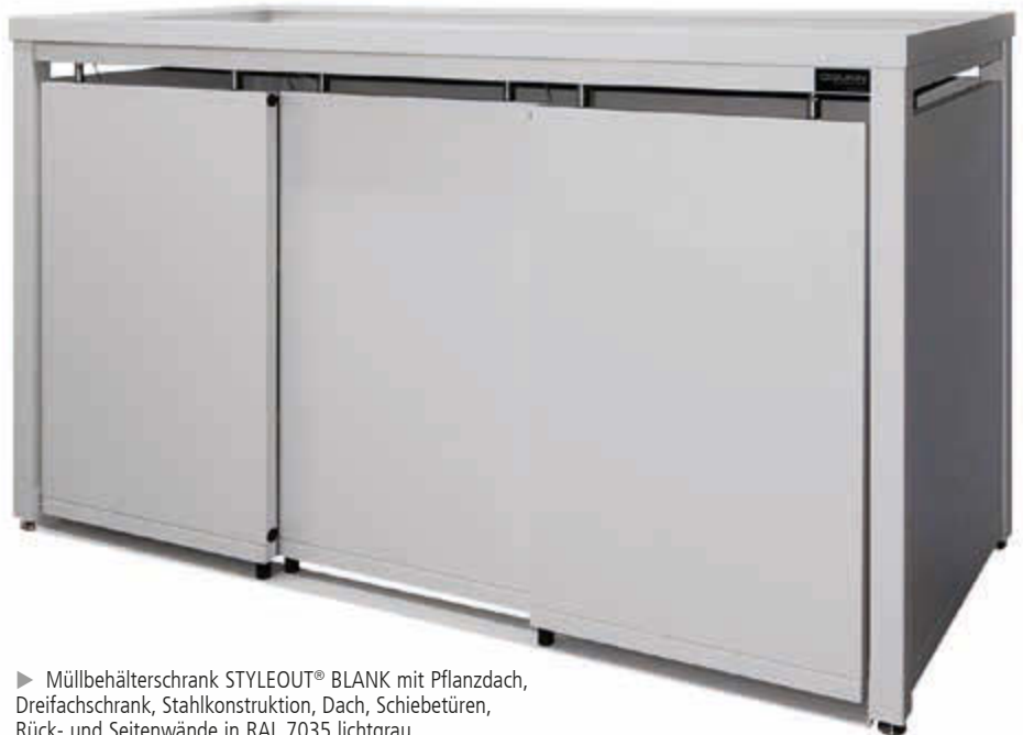
► Müllbehälterschrank STYLEOUT® BLANK mit Pflanzdach, Dreifachschrank, Stahlkonstruktion, Dach, Schiebetüren, Rück- und Seitenwände in RAL 7035 lichtgrau