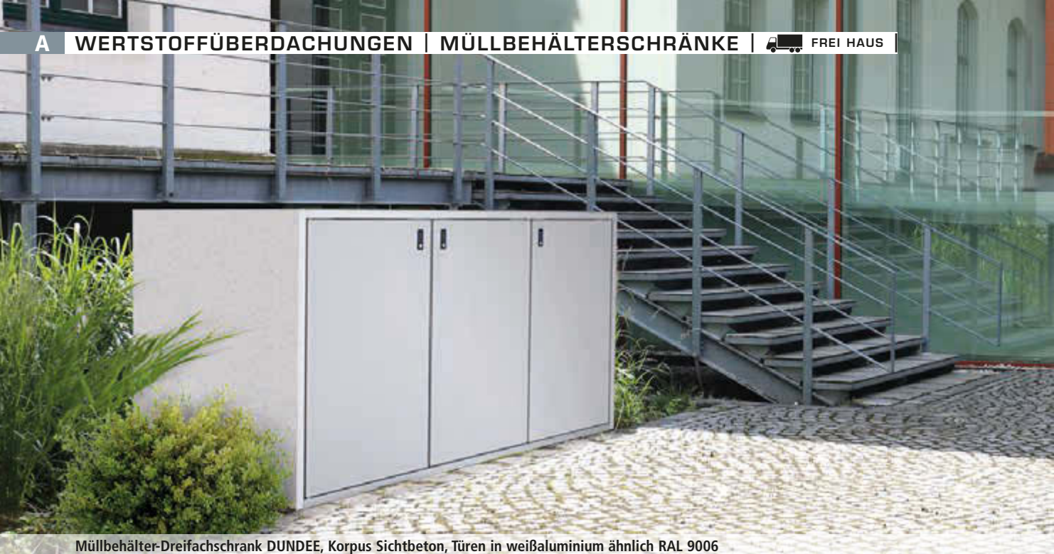
Müllbehälter-Dreifachschrank DUNDEE, Korpus Sichtbeton, Türen in weißaluminium ähnlich RAL 9006