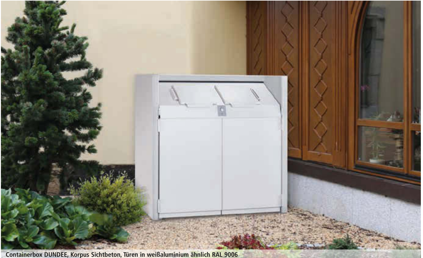
Containerbox DUNDEE, Korpus Sichtbeton, Türen in weißaluminium ähnlich RAL 9006