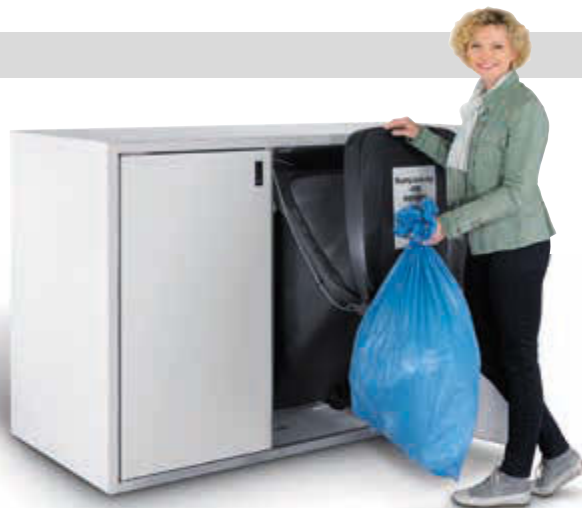
▲ Müllbehälter-Doppelschrank DUNDEE, Korpus Sichtbeton, Türen in weißaluminium ähnlich RAL 9006

Weitere Bilder, Informationen und Ausschreibungstexte: www.ziegler-metall.de