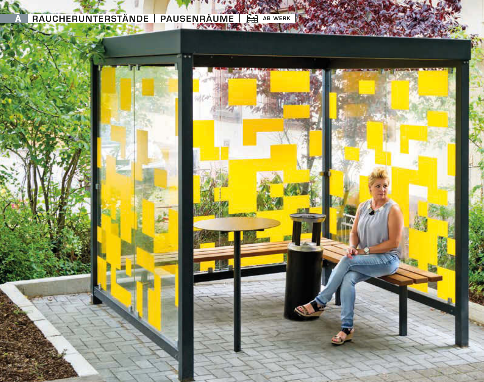
Raucherunterstand TOBACCO, Dachbreite x Dachtiefe 2400 mm x 2400 mm, mit Rück- und Seitenwänden, zweiseitige Sitzbank TOBACCO, Abfallbehälter / Ascher CALGARY sowie Stehtisch BISTROT, Stahlkonstruktion in RAL 7016 anthrazitgrau, Scheibendekorbeklebung bauseits