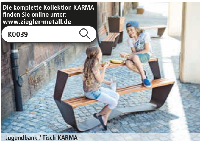
Jugendbank / Tisch KARMA