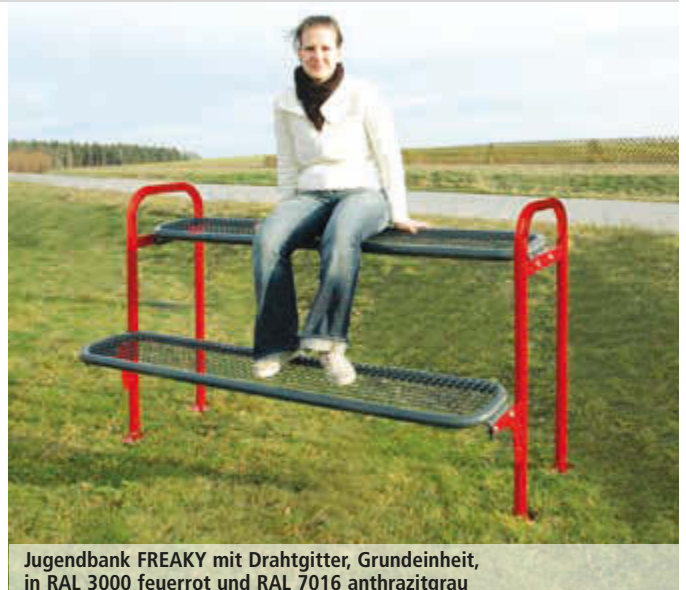
Jugendbank FREAKY mit Drahtgitter, Grundeinheit, in RAL 3000 feuerrot und RAL 7016 anthrazitgrau