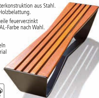
▲ Sitzbank KARMA ohne Rückenlehne, Stahlteile in DB 703 eisenglimmer