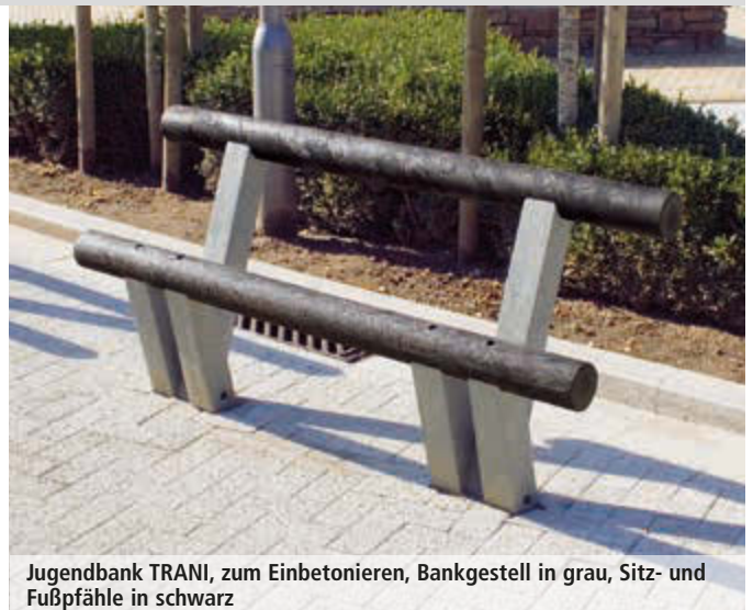
Jugendbank TRANI, zum Einbetonieren, Bankgestell in grau, Sitz- und Fußpfähle in schwarz