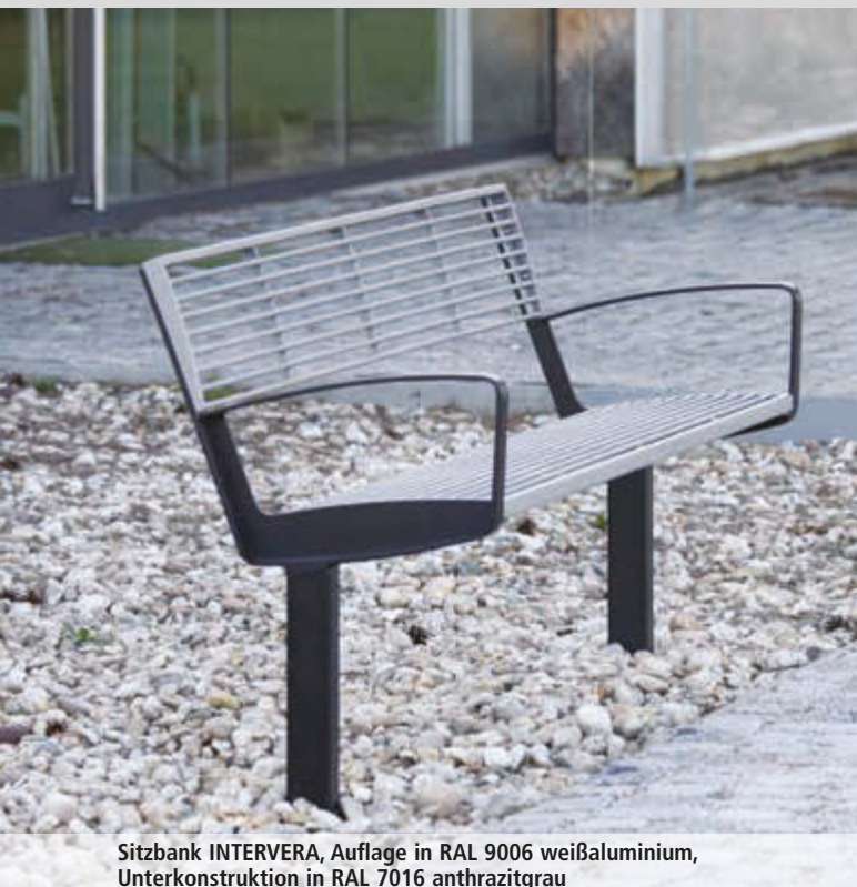
Sitzbank INTERVERA, Auflage in RAL 9006 weißaluminium, Unterkonstruktion in RAL 7016 anthrazitgrau