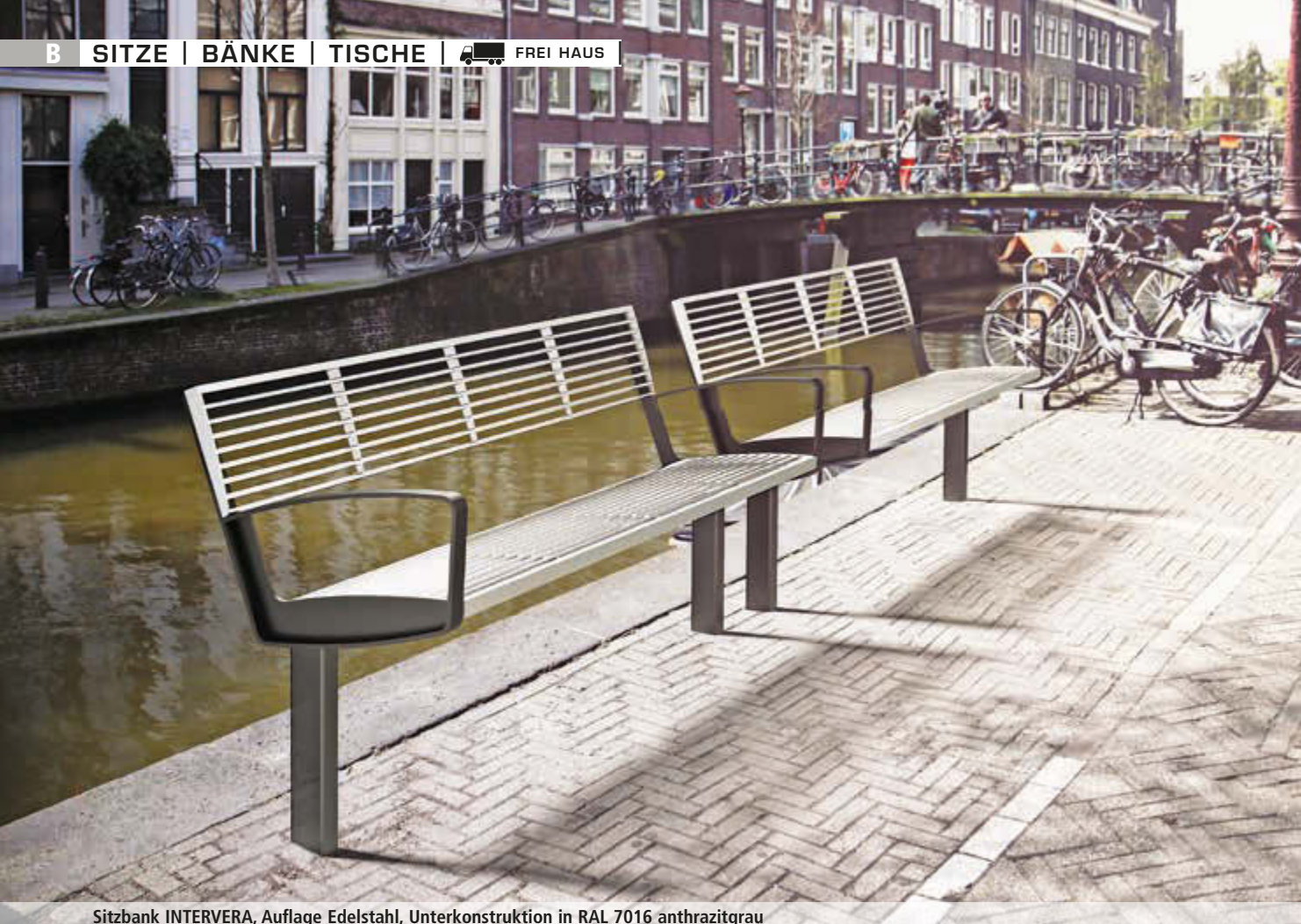
Sitzbank INTERVERA, Auflage Edelstahl, Unterkonstruktion in RAL 7016 anthrazitgrau