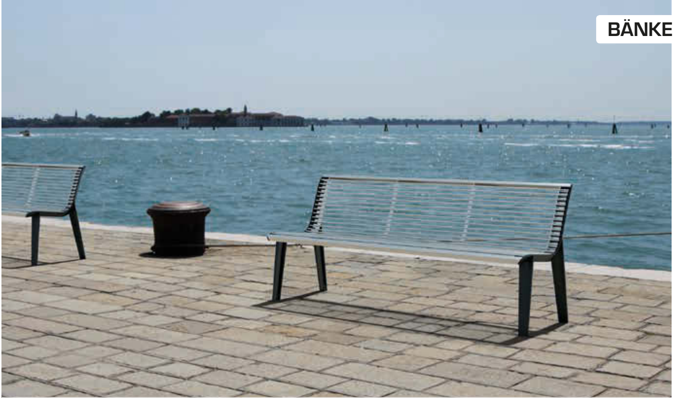
Sitzbank EMAU mit Rückenlehne, Auflage Edelstahl, Unterkonstruktion in RAL 7016 anthrazitgrau (auf Anfrage)