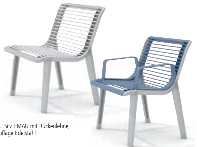
▲ Sitz EMAU mit Rückenlehne, Auflage Edelstahl

Sie benötigen 1 Set pro Sitz / Sitzbank.