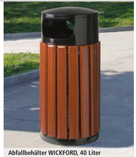
Abfallbehälter WICKFORD, 40 Liter