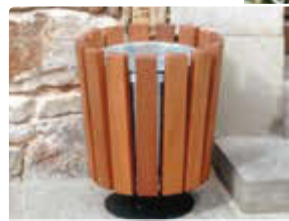
Abfallbehälter DORSET, zum freien Aufstellen