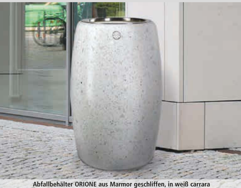
Abfallbehälter ORIONE aus Marmor geschliffen, in weiß carrara

aus Beton bzw. Marmor, wahlweise mit Ascher