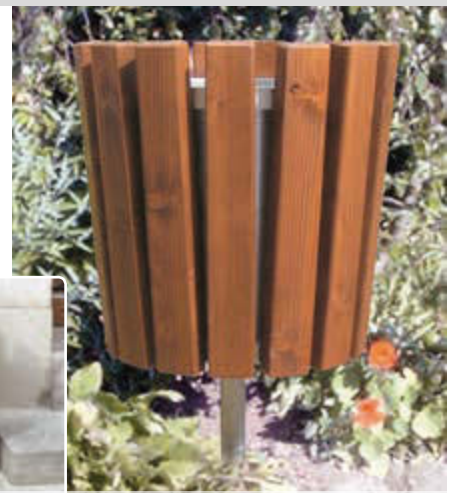
Abfallbehälter DORSET, zum Einbetonieren