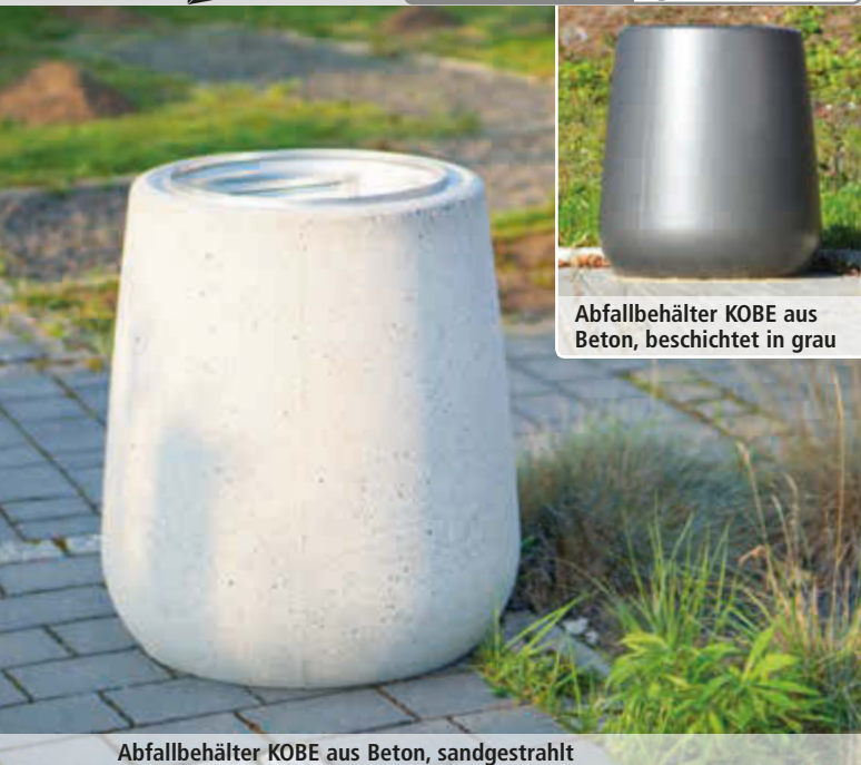
Abfallbehälter KOBE aus Beton, beschichtet in grau