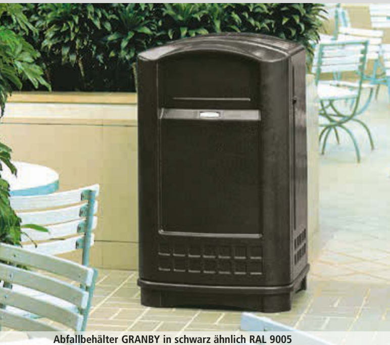
Abfallbehälter GRANBY in schwarz ähnlich RAL 9005