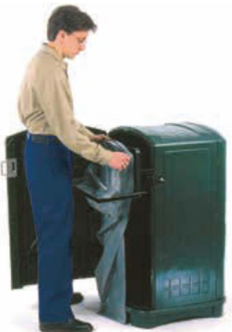
▲ standardmäßig mit ausfahrbarem Abfallsackhalter