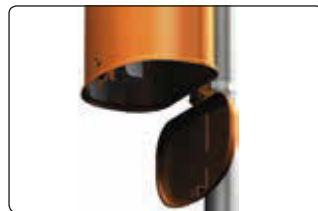
▲ Detail: Bodenklappe zur Entleerung geöffnet