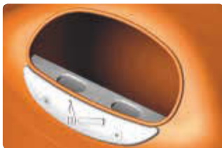
▲ Detail: Ascher