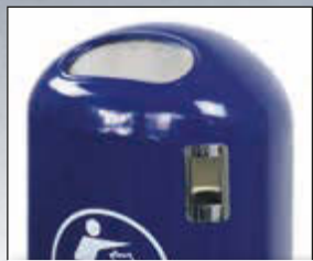
Ausführung mit Ascher finden Sie online unter: www.ziegler-metall.de

Konstruktion: Behälter aus Stahlblech mit selbstschließender Federeinwurfklappe aus Edelstahl. Behälterboden mit Flüssigkeitsablauföchern. Lieferung inkl. beiliegendem „Saubermännchen“-Aufkleber.