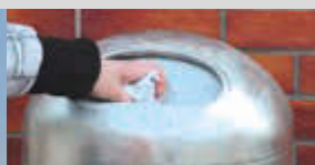
▲ Detail: Federeinwurfklappe z. B. gegen Eindringen von Vögeln