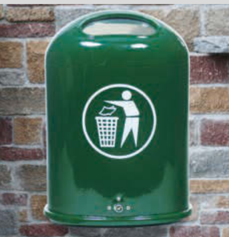
▲ Abfallbehälter DERBY mit Federeinwurfklappe, ohne Ascher, in RAL 6005 moosgrün