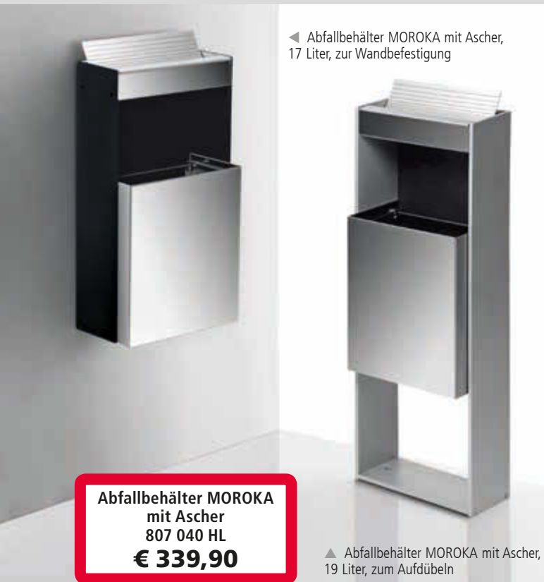
◀ Abfallbehälter MOROKA mit Ascher, 17 Liter, zur Wandbefestigung