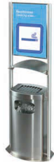
▲ Abfallbehälter CRUZ mit Ascher, mit Schutzdach und Werbefläche, mit Poster „Raucherzone“ (Zubehör)