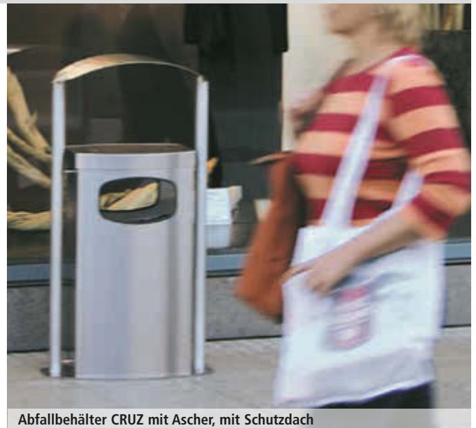
Abfallbehälter CRUZ mit Ascher, mit Schutzdach

Standascher CRUZ finden Sie auf Seite 357.