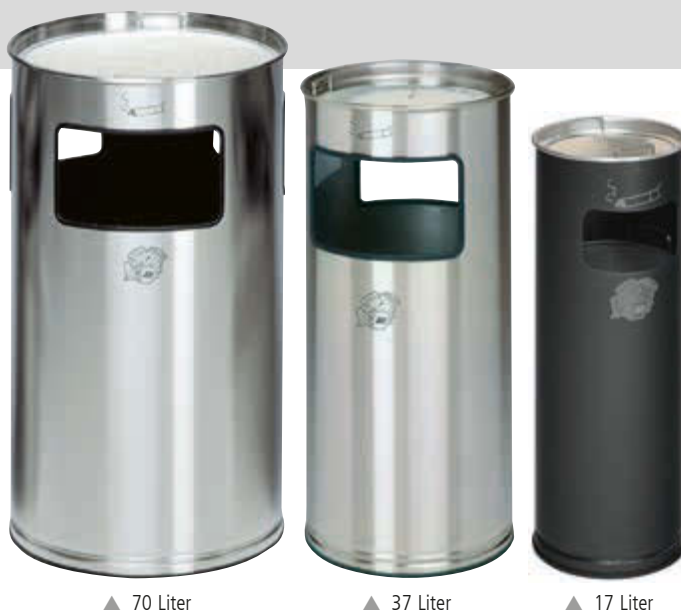
▲ 70 Liter