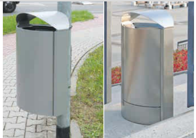
▲ Abfallbehälter CAPITAL aus Stahl, zur Pfostenbefestigung, in DB 702 eisenglimmer 50 Liter, zum freien Aufstellen