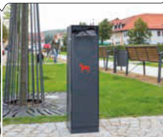
Hundetoilette CRYSTAL, s. S. 360