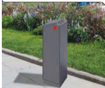
Standascher CRYSTAL, s. S. 357

Standascher CRYSTAL und Hundetoilette CRYSTAL finden Sie auf den Seiten 357 und 360.