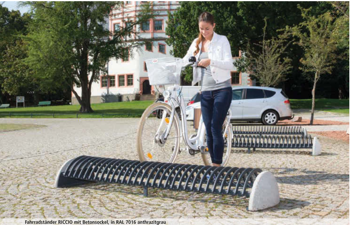
Fahrradständer RICCIO mit Betonsockel, in RAL 7016 anthrazitgrau