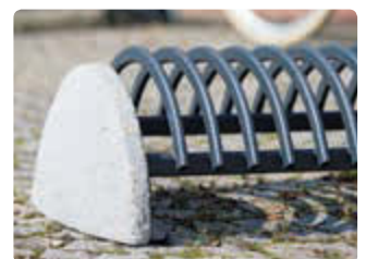
▲ Detail: Betonsockel