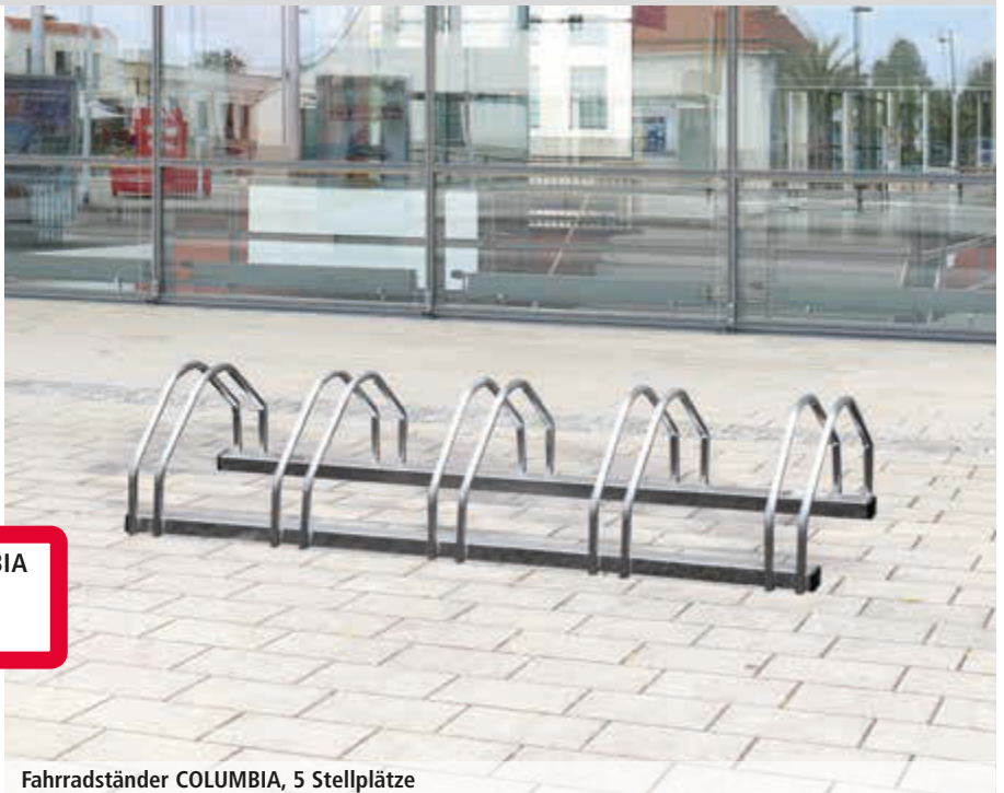
Fahrradständer COLUMBIA, 5 Stellplätze

Fahrradständer COLUMBIA 734 011 HL € 98,90