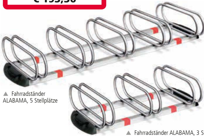
▲ Fahrradständer ALABAMA, 5 Stellplätze

Fahrradständer ALABAMA 483 040 HL € 193,30