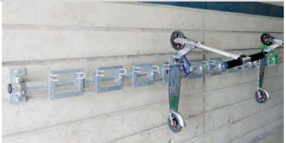
Reihenanlage Scooter-Parker CHARLOTTE bestehend aus 3 Montageplatten und Querrohr 2750 mm, 10 Stellplätze