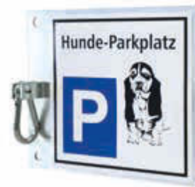
▲ Hunde-Parkplatz BEAGLE zur Wandbefestigung, feuerverzinkt

Konstruktion: Grundplatte aus Stahlblech mit PVC-Standardaufdruck (200 x 200 mm), wie Abbildung. Ausführungen zur Bodenbefestigung mit zusätzlichem Standpfosten. Serienmäßig mit Karabiner.