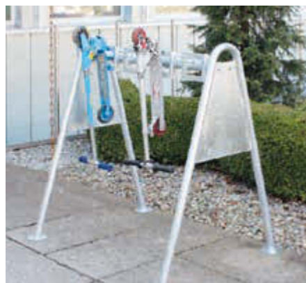
Scooter-Parker CHARLOTTE mit 2 Stück Freiständerkonsolen (Mehrpreis)