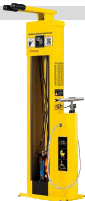
▲ Servicestation ASSIST, Modell „BASIC“