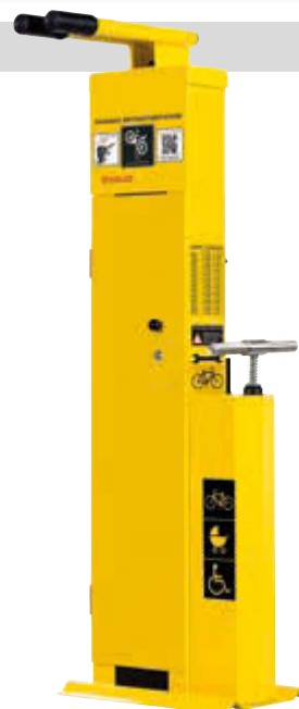
▲ Servicestation ASSIST, Modell „PREMIUM“