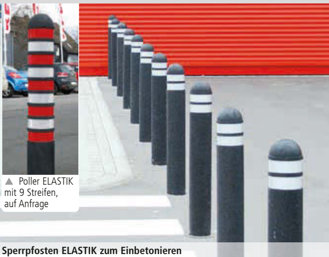
▲ Poller ELASTIK mit 9 Streifen, auf Anfrage

Konstruktion: Runder Sperrpfosten aus vulkanisiertem Gummi.