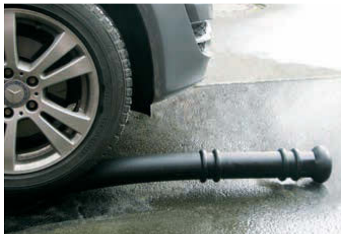
Sperrpfosten ADULAR, bis 90° biegsam