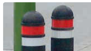
▲ Retroreflexstreifen in weiß und rot (siehe Mehrpreis)