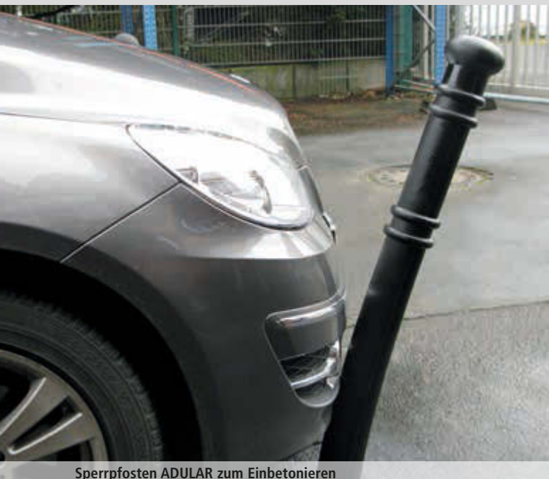
Sperrpfosten ADULAR zum Einbetonieren