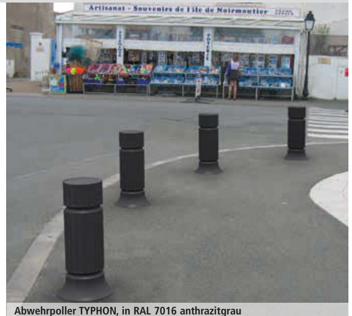
Abwehrpoller TYPHON, in RAL 7016 anthrazitgrau

Weitere Abwehrpoller finden Sie online unter: www.ziegler-metall.de