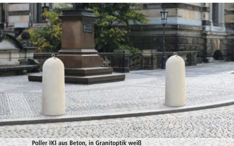
Poller IKI aus Beton, in Granitoptik weiß