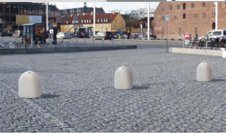
Poller TIP aus Beton, in Granitoptik weiß

Konstruktion: Poller aus Beton bzw. Marmor mit abschraubbarer Öse, zur Befestigung an Masten, Stützen, Haltebänken, Stoppblechen (siehe Zubehör).