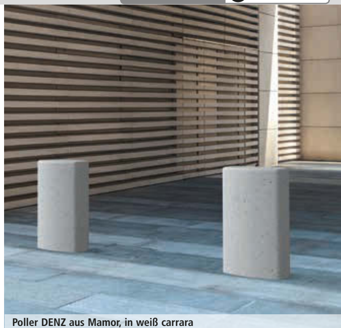
Poller DENZ aus Marmor, in weiß carrara