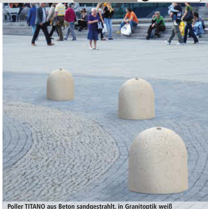
Poller TITANO aus Beton sandgestrahlt, in Granitoptik weiß

Standardfarben Marmor für diese Doppelseite - bitte bei Bestellung Farbe angeben!