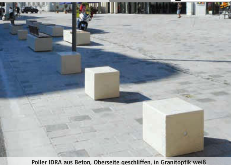
Poller IDRA aus Beton, Oberseite geschliffen, in Granitoptik weiß

Konstruktion: Poller aus Beton bzw. Marmor mit einer Stahlbewehrung verstärkt. Alle Kanten sind abgerundet.