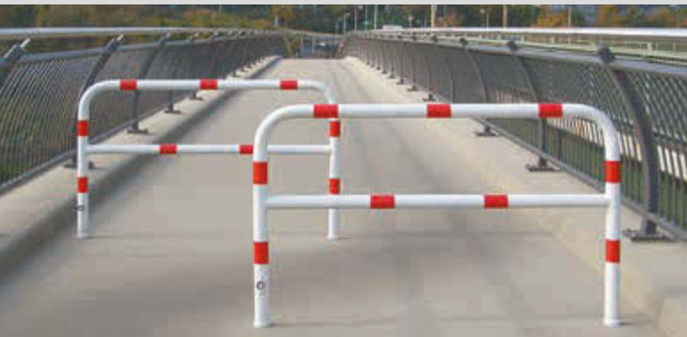
Sperrzaun VIHTI, verschließbar, feuerverzinkt und weiß pulverbeschichtet mit roten Reflexstreifen

Konstruktion: Sperrzaun aus Stahlrundrohr, Ø 60 mm.