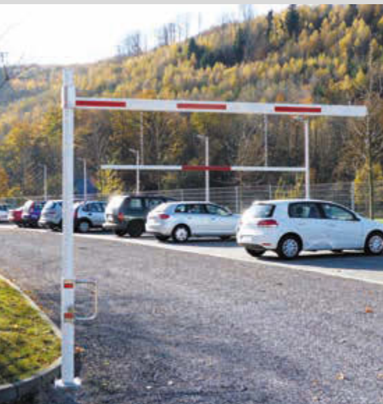
Höhenbegrenzungssperre RAUMO, drehbar, mit beweglicher Barriere, Sperrbreite 3,00 m

Konstruktion: Horizontal drehbare, alle 90° verriegelbare und ab 1000 mm stufenlos verstellbare Höhenbegrenzungssperre. Bestehend aus einer Hauptstütze aus Stahlrohr (Ø 102 mm), einem Drehbügel aus Edelstahl und einem Aluminium-Sperrbalken (86 x 46 mm) mit Antisitzschutz und Seilzugverstärkung. Lichte Durchfahrts Höhe bis maximal 2800 bzw. 3800 mm. Barrierenabhängung aus Aluminium siehe Zubehör. Auf Anfrage mit Auflagestütze.