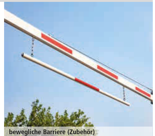
bewegliche Barriere (Zubehör)