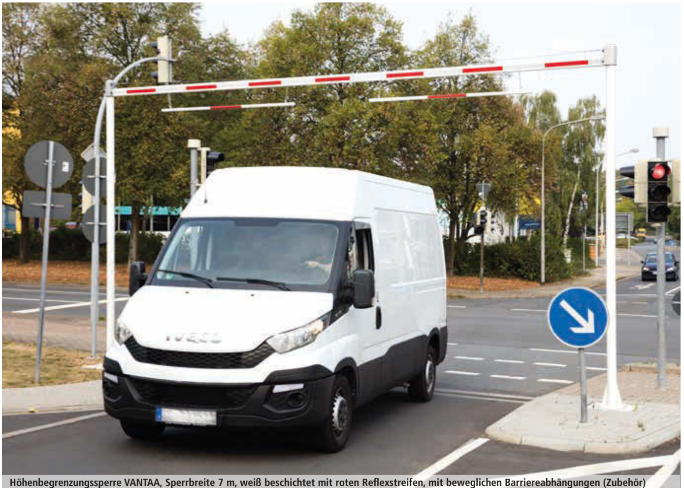
Höhenbegrenzungssperre VANTAA, Sperrbreite 7 m, weiß beschichtet mit roten Reflexstreifen, mit beweglichen Barriereabhängungen (Zubehör)