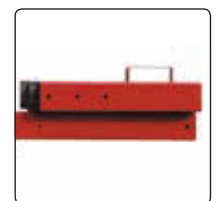
▲ Detail: Gegengewicht