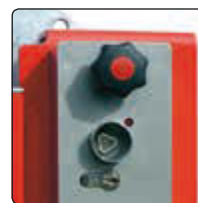
▲ Schlosskasten mit Feuerwehdreikant und Profilhalbzylinder für Hauptstütze