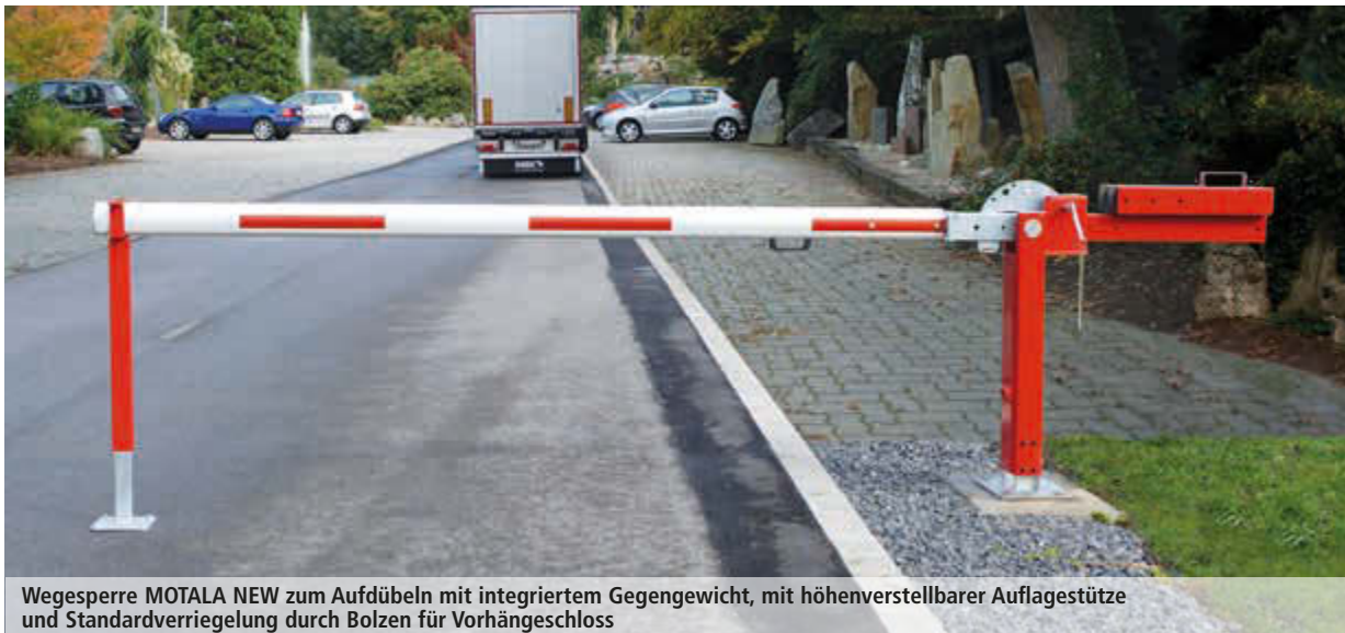
Wegesperre MOTALA NEW zum Aufdübeln mit integriertem Gegengewicht, mit höhenverstellbarer Auflagestütze und Standardverriegelung durch Bolzen für Vorhängeschloss