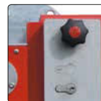
▲ Schlosskasten mit Profilhalbzylinderschloss und Blind-PZ-Einsatz (siehe Zubehör)