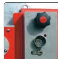
▲ Schlosskasten mit Feuerwehdreikant und Profilhalbzylinder für Hauptstütze