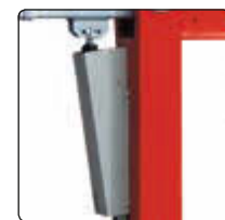
▲ Detail: Gasdruckfeder