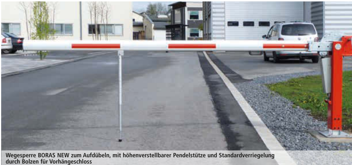
Wegesperre BORAS NEW zum Aufdübeln, mit höhenverstellbarer Pendelstütze und Standardverriegelung durch Bolzen für Vorhängeschloss