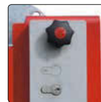
▲ Schlosskasten mit Profilhalbzylinderschloss und Blind-PZ-Einsatz (siehe Zubehör)