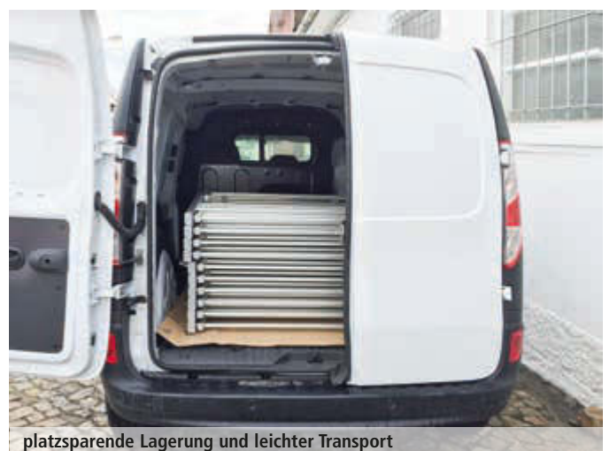
platzsparende Lagerung und leichter Transport