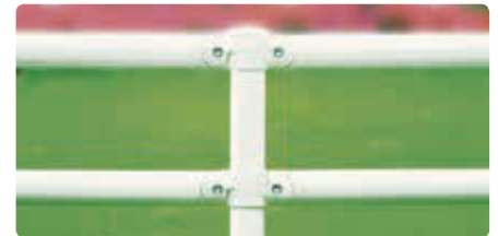
▲ lackiert in RAL 9016 verkehrsweiß