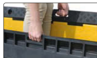
▲ Detail: Tragegriffe