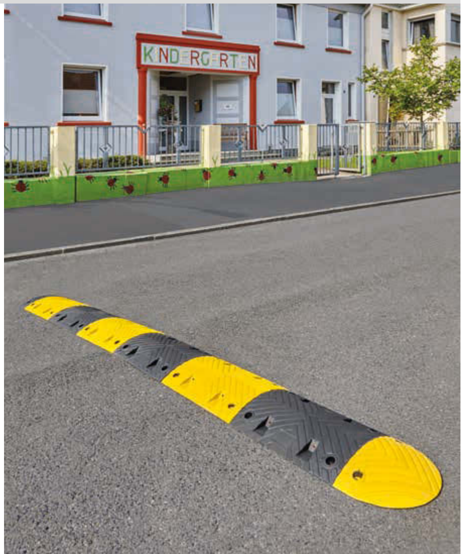
Fahrbahnschwellen-Set KAMP aus Recyclinggummi, Länge 3500 mm