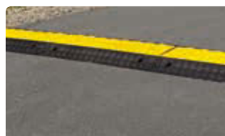
▲ Kabelbrücke BLAIK, 3-fach