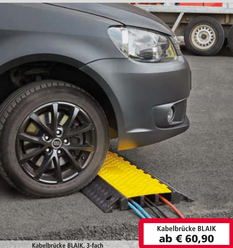
Kabelbrücke BLAIK, 3-fach