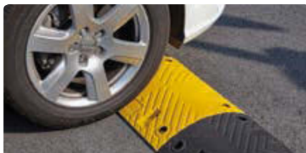
Fahrbahnschwellen KAMP aus Recyclinggummi