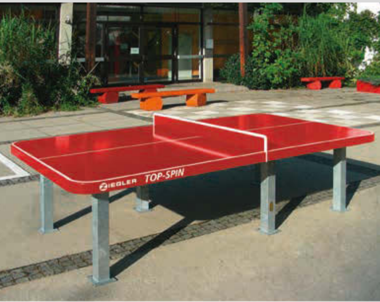
Tischtennisplatte TOP-SPIN, zum Aufdübeln, in RAL 3000 feuerrot