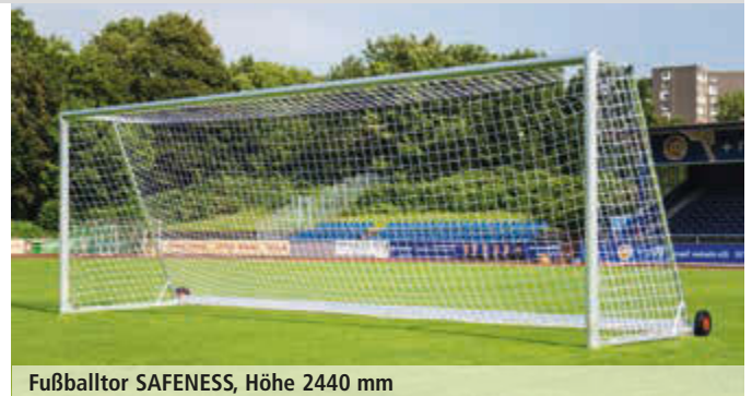
Fußballtor SAFENESS, Höhe 2440 mm