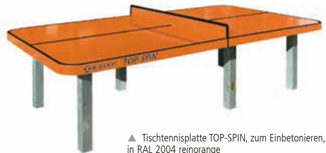
▲ Tischtennisplatte TOP-SPIN, zum Einbetonieren, in RAL 2004 reinorange