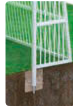
▲ Mehrpreis Pfostenverlängerung