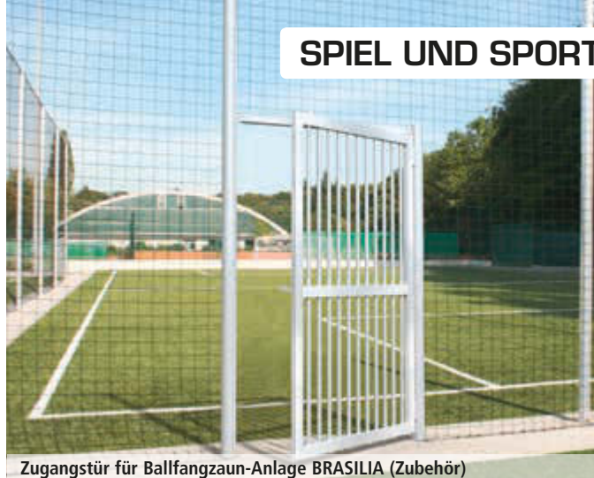
Zugangstür für Ballfangzaun-Anlage BRASILIA (Zubehör)