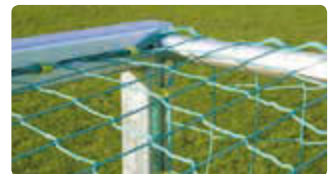
▲ Netz grün, 3 mm stark, Polypropylen