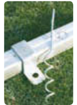
▲ Zubehör: Antikipp-sicherung für Naturrasen