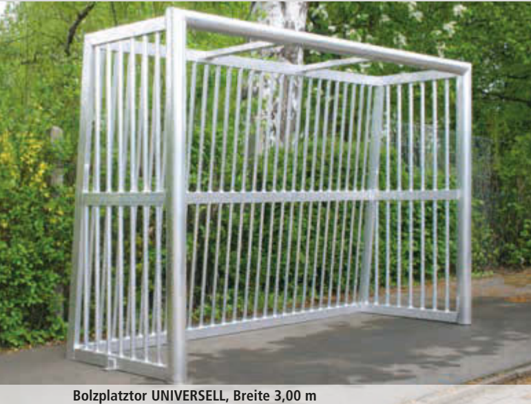
Bolzplatztor UNIVERSELL, Breite 3,00 m

Konstruktion: Bolzplatztor aus Aluminium, komplett in einem Stück verschweißt. Torrahmen aus Ovalprofil 120 x 100 mm. Ballfangrohre aus 30 mm Rundrohr, stabilisiert durch rechteckige hintere Querrohre. Bodenrahmen mit 4 oder 5 (je nach Torgröße) angeschweißten Winkeln mit Lochbohrungen zum Befestigen der Bodenverankerungen. Abstand der Ballfangrohre nach Vorschrift 85 mm.