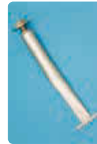
▲ Zubehör: Bodenverankerung für Hartplätze