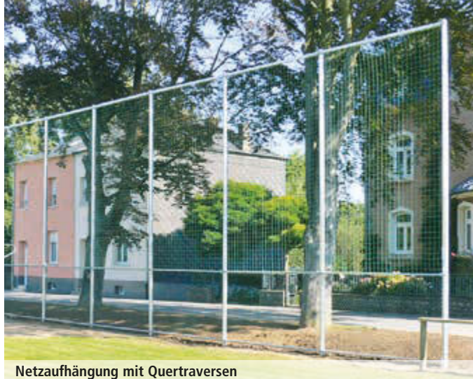
Netzaufhängung mit Quertraversen