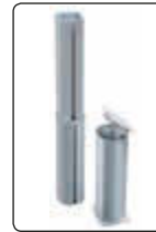
▲ Zubehör: Adapterkonstruktion bestehend aus Adapter und Boden-hülse mit Deckel