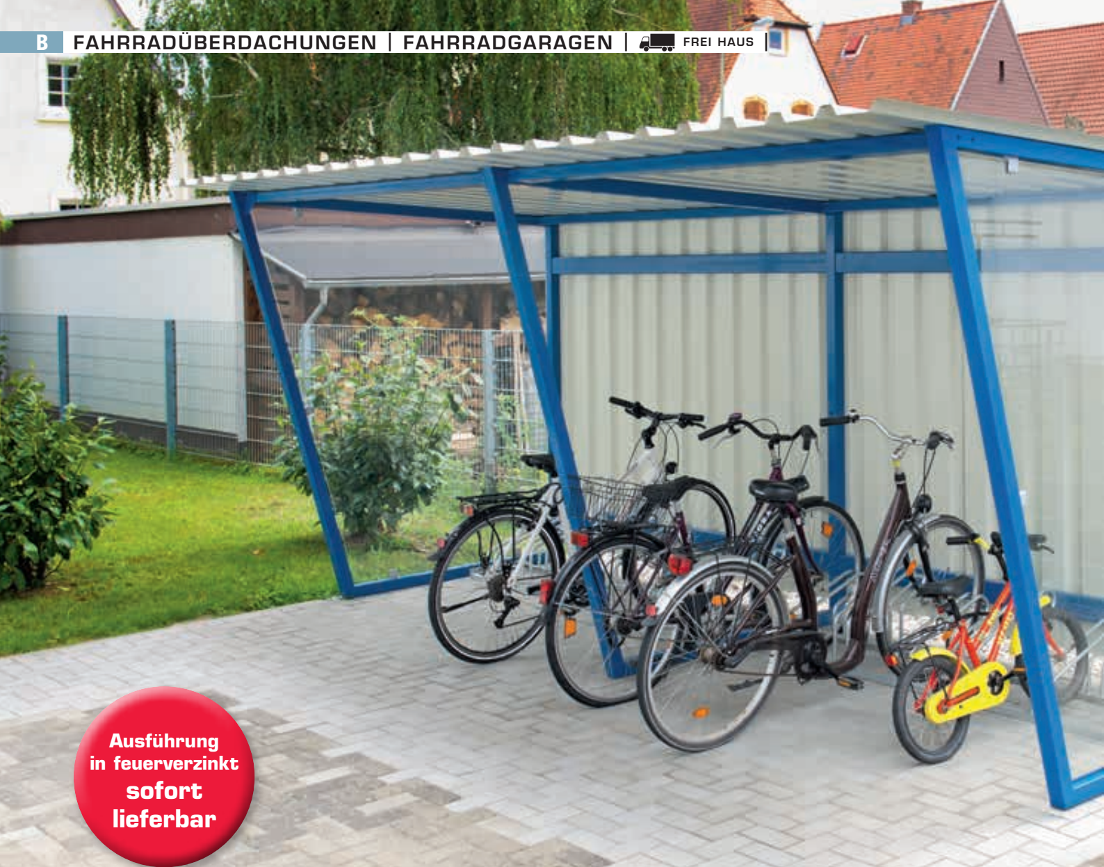
Fahrradüberdachung Z05, Dachbreite x Dachtiefe 4820 mm x 2400 mm, mit Rück- und Seitenwänden sowie Fahrradständer UNIVERSAL, Stahlkonstruktion in RAL 5019 capriblau