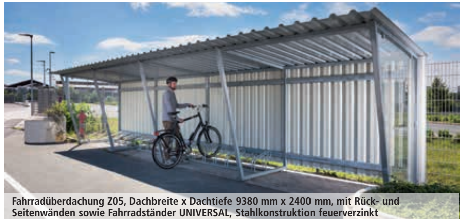
Fahrradüberdachung Z05, Dachbreite x Dachtiefe 9380 mm x 2400 mm, mit Rück- und Seitenwänden sowie Fahrradständer UNIVERSAL, Stahlkonstruktion feuerverzinkt

Bitte fragen Sie an – gerne erstellen wir Ihnen kostenfrei ein individuelles Angebot für Ihr Bauvorhaben: Tel 076 72 / 9 58 95