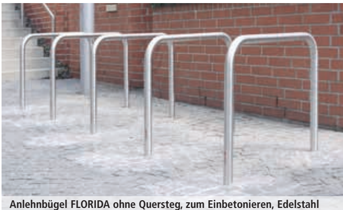
Anlehnbügel FLORIDA ohne Quersteg, zum Einbetonieren, Edelstahl