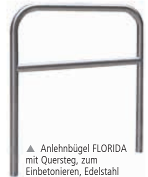
▲ Anlehnbügel FLORIDA mit Quersteg, zum Einbetonieren, Edelstahl