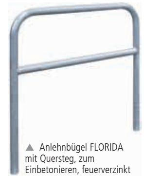
▲ Anlehnbügel FLORIDA mit Quersteg, zum Einbetonieren, feuerverzinkt