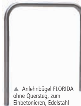
▲ Anlehnbügel FLORIDA ohne Quersteg, zum Einbetonieren, Edelstahl