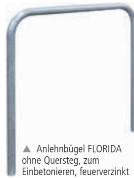
▲ Anlehnbügel FLORIDA ohne Quersteg, zum Einbetonieren, feuerverzinkt