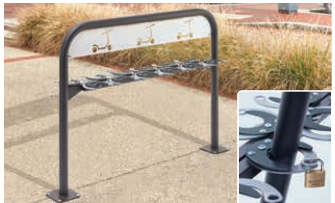
Scooter-Parker MANILA doppelseitig, zum Aufdübeln