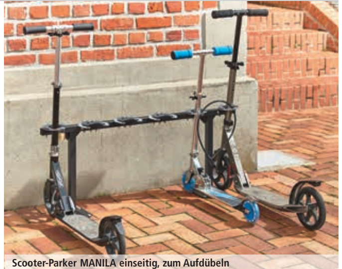
Scooter-Parker MANILA einseitig, zum Aufdübeln