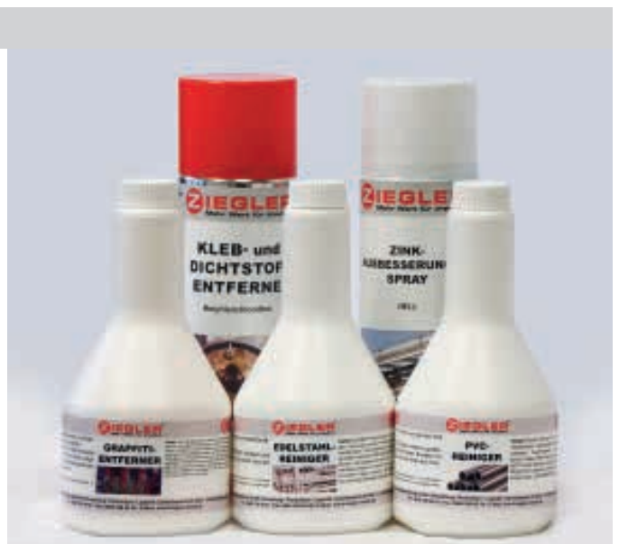
Graffiti-entferner, Edelstahlreiniger, PVC-Reiniger, Dicht- und Klebstoffentferner sowie Zinkausbesserungsspray hell

Graffiti-entferner: Zur Entfernung von Spraylacken auf Metallen, Glas, Keramik sowie harten Kunststoffen (flüssig und CKW-frei).