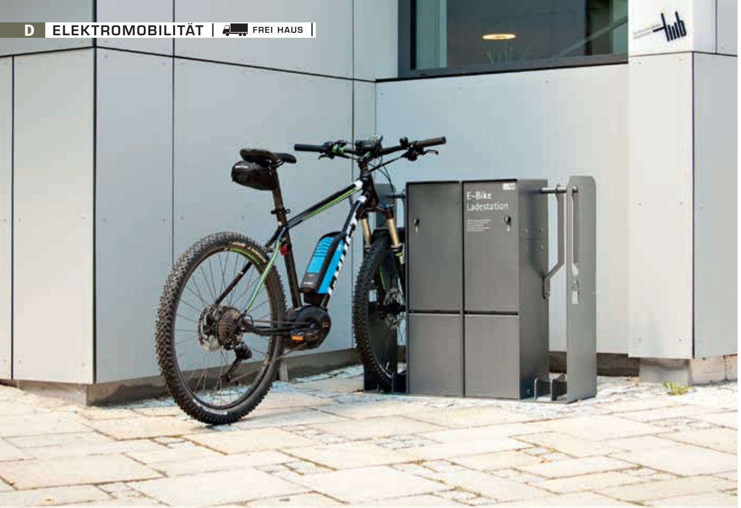
Fahrrad-Abstellanlage VELO-CONNECTOR mit Ladeschließfach, für Radeinstellung links bzw. rechts, Stahlteile in DB 703 eisenglimmer