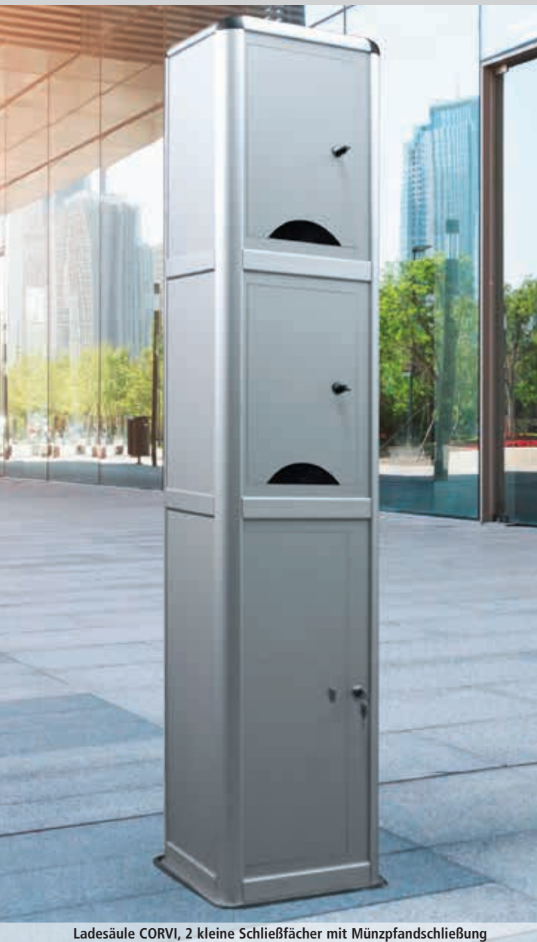
Ladesäule CORVI, 2 kleine Schließfächer mit Münzpfandschließung

Konstruktion: Witterungsbeständige Konstruktion aus rostfreiem Aluminium. Schließfächer serienmäßig mit Steckdose inkl. Steckdosenüberwachung sowie mit aktiver Belüftung und Innenraumbeleuchtung ausgestattet. Ausführung mit elektronischem Zugang serienmäßig inklusive LED-Statusanzeige und Türüberwachung. 2 Ladeboxen mit je einem Schließfach übereinander (1-reihig). Türen mit Durchlass zur Herausführung eines bauseitigen Ladekabels. Druck und Beklebung mit Werbefolie auf Anfrage.