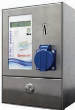
▲ Elektroroller- / E-Bike-Ladestation MONEDA mit Münzkassiersystem ETC 4000, LCD-Anzeige