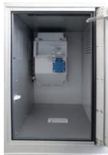
▲ Innenansicht Schließfach mit Elektroinstallation