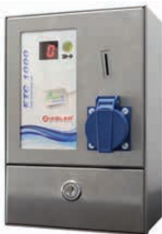
▲ Elektroroller- / E-Bike-Ladestation MONEDA mit Münzkassiersystem ETC 1000, LED-Anzeige