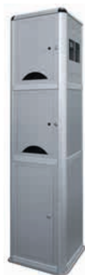
▲ Ladesäule CORVI, 2 kleine Schließfächer, integrierte Steuerzentrale mit Zugangsautorisierung PIN-Code

Lieferung: Fertig montiert. Anschlussfertig vorverdrahtet und nach der Installation und Inbetriebnahme durch eine Elektrofachkraft sofort betriebsbereit.