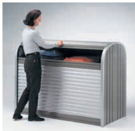
▲ zum Befüllen nur obere Rolllade öffnen