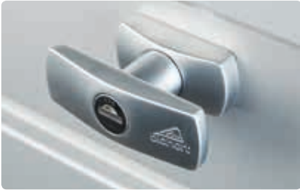
▲ Detail: Griff mit Schloss