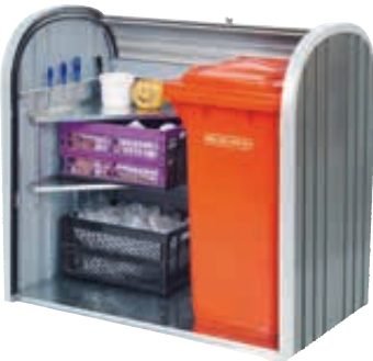
▲ Variante mit Eckregal (Zubehör)