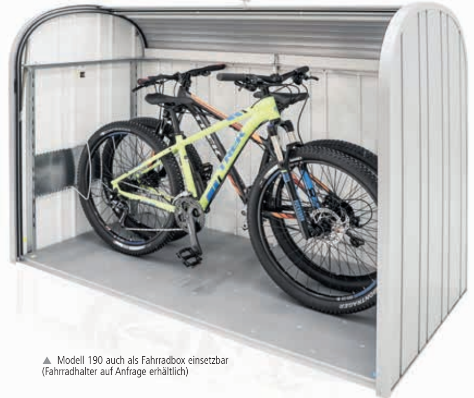
▲ Modell 190 auch als Fahrradbox einsetzbar (Fahrradhalter auf Anfrage erhältlich)