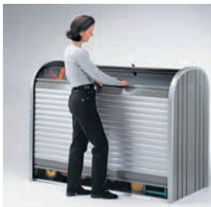
▲ zum kompletten Entleeren untere Rolllade ebenfalls nach hinten schieben