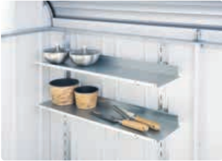
▲ Regal-Set (Zubehör)