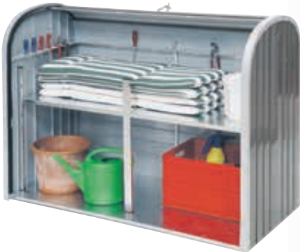
▲ Variante mit Zwischenboden (Zubehör)